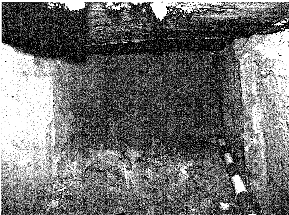
Interior de la Tumba II en el momento de su apertura.