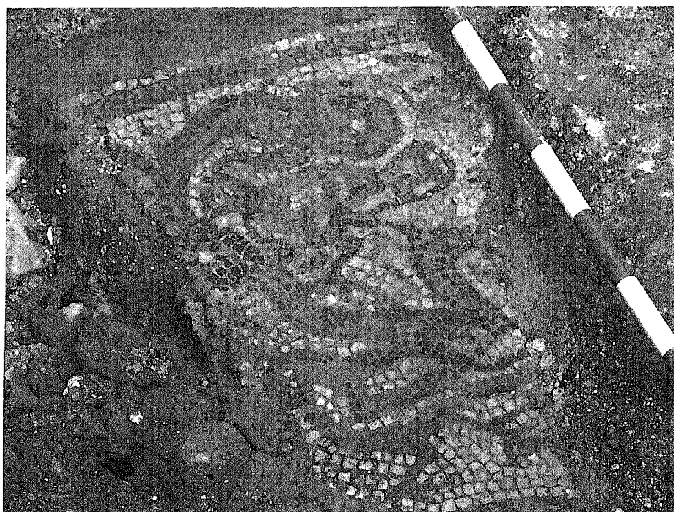
Mosaico funerario de las Palomas. Tumba IV