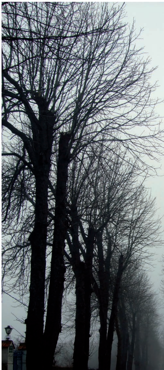
Carretera Ezcaray-Valgañón, en la actualidad.

Esa carretera camino a Valgañón, esa casa denominada “La Gaviota”, esa veleta que asiste impertérrita a los medidos azares del paso del tiempo se constituyen en paisaje único y referencia mítica para todos los amantes del cine.