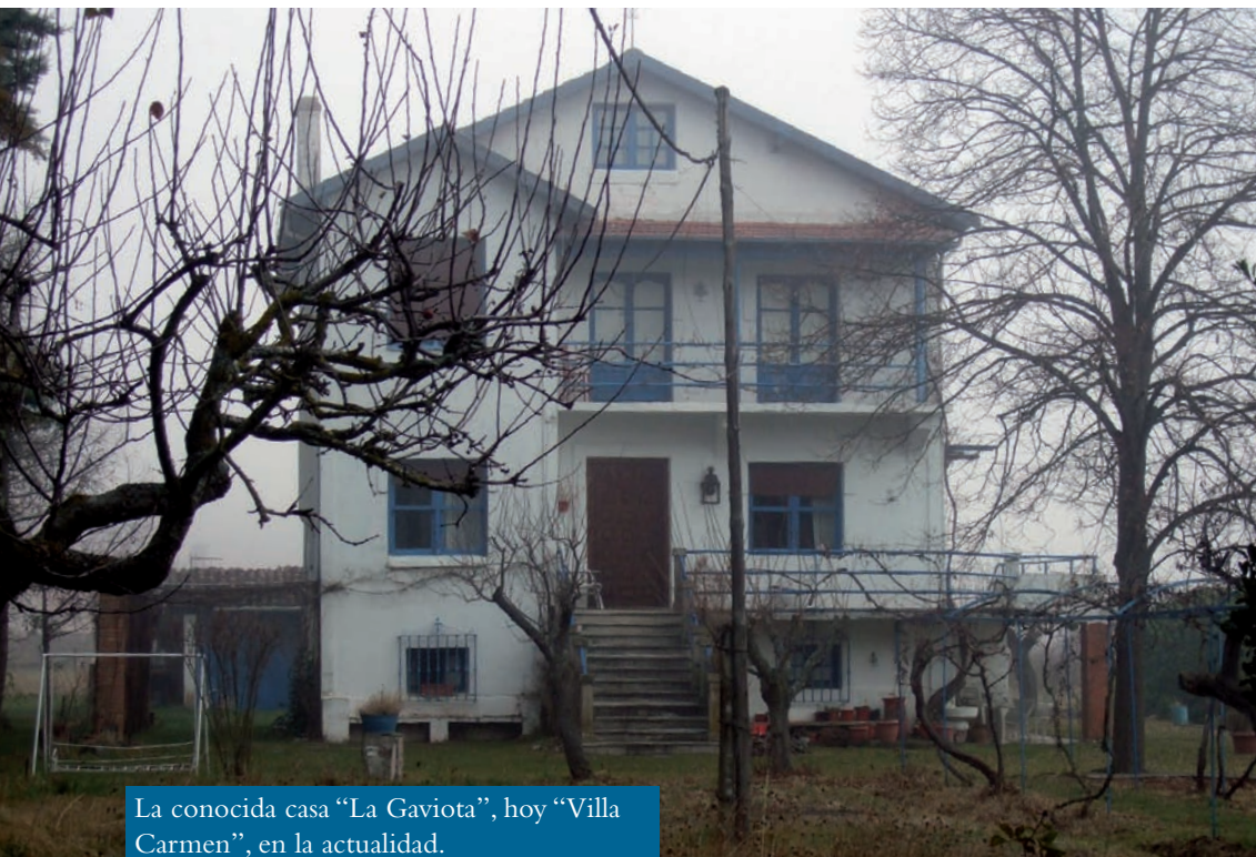
La conocida casa “La Gaviota”, hoy “Villa Carmen”, en la actualidad.

allí, aparte del padre en moto, circulan la joven Estrella en bicicleta, y la familia (tía y abuela de Estrella) que viene del sur. No quiero dejar pasar por alto la hermosa elipsis que se produce cuando Estrella sale de casa por la carretera en bicicleta con 8 años y vuelve con 15, un salto no sólo temporal sino también de maduración del personaje.