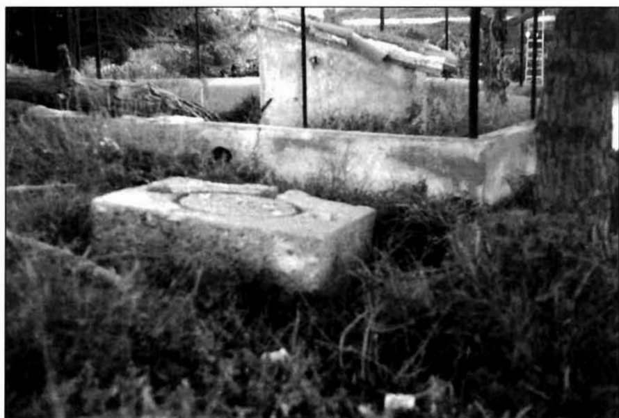
LÁMINA II (FOTOGRAFÍA N° 2). Pie de prensa localizado en el Río Seco.