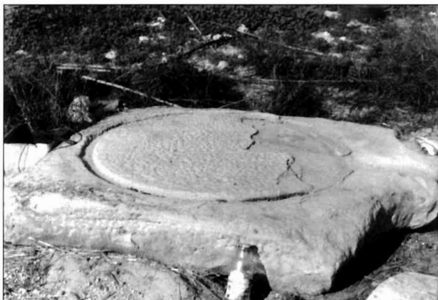
LÁMINA I (FOTOGRAFÍA N° 1). Pie de prensa procente del Convento de San Ginés.