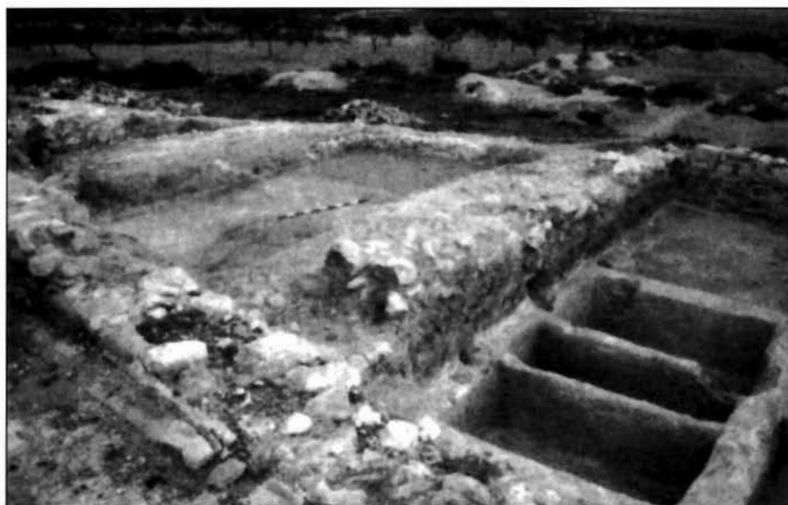
Almazara romana de Los Villaricos.

por las mismas fechas el núcleo urbano principal del territorio, al cual abastecerían varias villae , como la anterior, circundantes. Como señala la mayoría de los investigadores, debió de ser la Mula del Pacto de Teodomiro del año 713 d.C., primitivo asentamiento de la ciudad actual fundada por el Islam 3 .