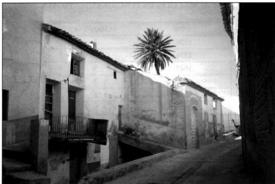
Almazara de Cuadrado. La edificación que se conserva es del siglo XVIII.