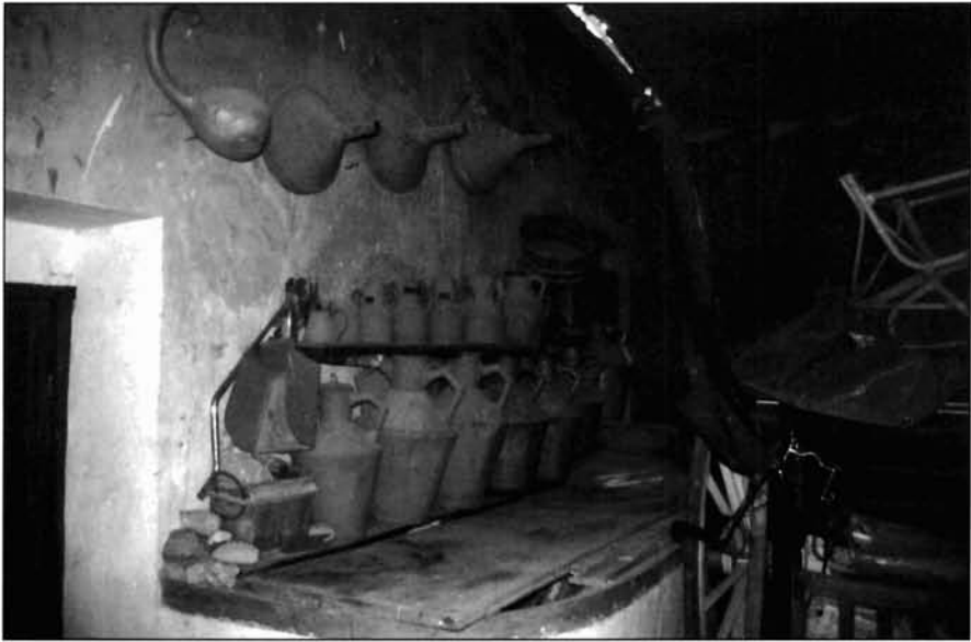
Recipientes para medir el aceite y otros utensilios indispensables en cualquier almazara.