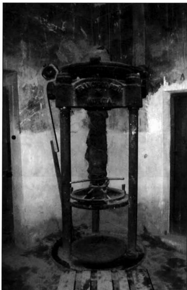
Prensa de hierro de la almazara del Agua, quizás de finales del siglo XIX.