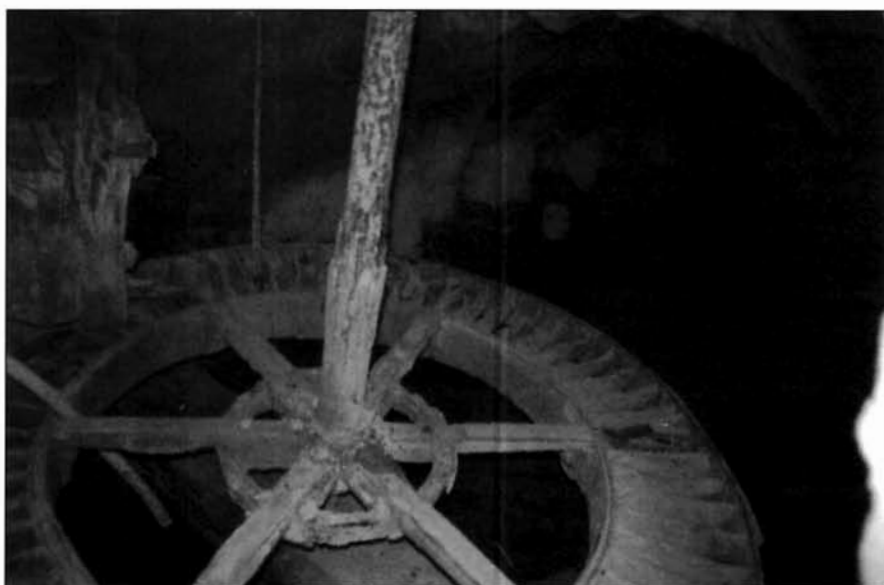
Rodete o rueda hidráulica de la almazara.

gastos derivados de ello iban a cuenta de los almazareros. Si excedía tal plazo, competía a don García por quien se les ha de abonar media arroba de aceite por día, esto es, siendo la quiebra en los tres meses de enero, febrero o marzo; si se había producido antes o después de los tres meses, les debía abonar a los inquilinos un cuarterón por día.