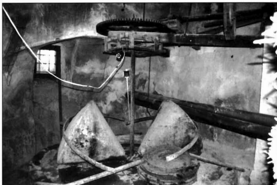
Vista interior de la almazara del Agua, posiblemente la más antigua conservada de la región.

molinos 27 . La campaña duraría hasta principios de julio, muy tarde, sin otra excusa que las nefastas condiciones climáticas. A continuación, hemos colocado las cantidades molidas por meses.