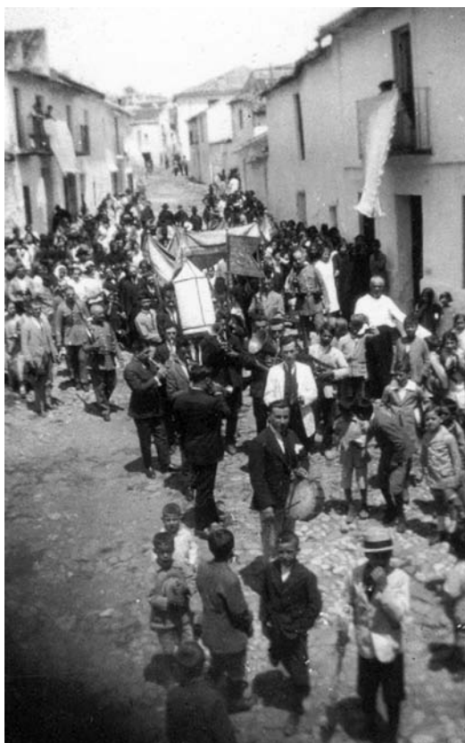
Procesión del Corpus Cristi del año 1920 a su paso por la calle del Cura. Justamente en este lugar se encontraba el Ayuntamiento.