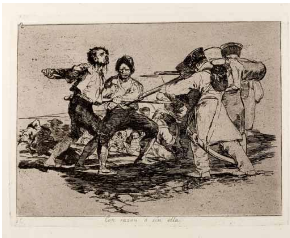
Con razón o sin ella. Fondo Ibercaja. Grabado de Goya. Serie "Los desastres de la guerra".

hacia la ruta de Albarracín y un sendero escarpado que baja directamente al puente y a la ciudad. Por todas partes se habían abierto zanjas y cortaduras, y obstruido los senderos con árboles talados.