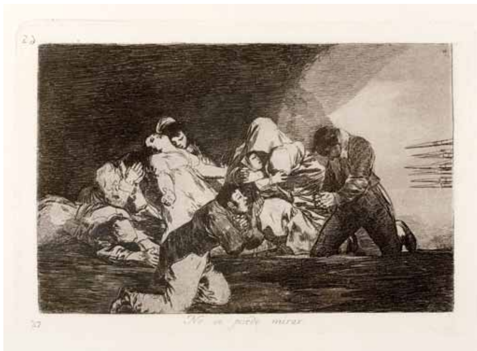
No se puede mirar. Fondo Ibercaja. Grabado de Goya. Serie "Los desastres de la guerra".

fuego a los franceses". 12 El tiempo transcurrido, sin embargo, había jugado a favor de los ocupantes que pudieron recomponer sus fuerzas y hacer frente al ejército de Blake el 15 en María alejando el peligro de los muros de Zaragoza y ocasionándole una seria derrota, 3 días después, en Belchite. Solo entonces pudo dirigirse de nuevo a Napoleón para transmitirle la idea de que se había dado un gran paso para establecerse en el territorio aragonés: "La batalla de Zaragoza [María], decía, consiguió repeler con fuerza el enemigo de esta capital, la de Belchite ha convertido esta retirada en derrota y liberado Aragón". 13