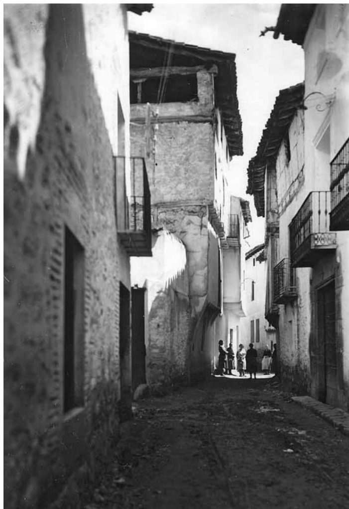
Gea de Albarracín. Centro de reclutamiento de las tropas de Villacampa. (Archivo López Segura).

de está construido el convento con todas sus dependencias. La cumbre de la montaña está rodeada de picos y de roquedos que forman una especie de parapeto con troneras, mientras que los flancos, guarnecidos de abetos, dan a esta montaña aislada un aspecto sombrío e imponente. Los caminos de Albarracín, de Daroca y de Molina vienen a reunirse en Orihuela donde hay un puente. El convento no tiene más comunicaciones que un mal camino que desciende por detrás de la montaña