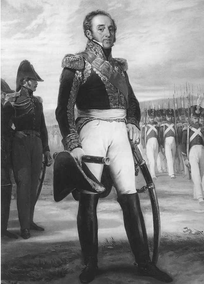
Retrato del mariscal Suchet.