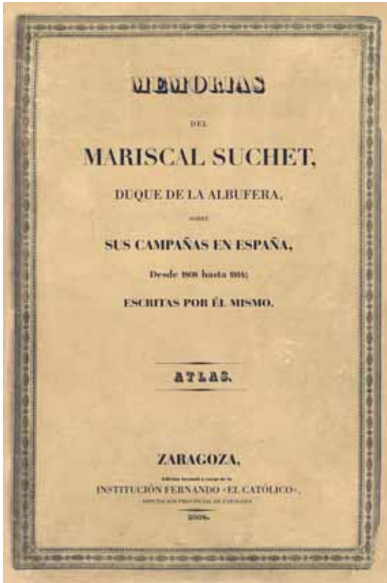
Portada Atlas de Suchet.

En 1805 participará en la campaña de Alemania bajo las órdenes del mariscal Sout. Su hoja de servicios registra haber participado en los combates más importantes que tuvieron lugar en centroeuropa. Es el caso de la batalla de Ulm, en octubre de 1805, y, el 2 de diciembre, de la batalla de Austerlitz en la que el ejército austrohúngaro fue totalmente derrotado. Al año siguiente, en 1806, a las órdenes de Lannes, participará en las batallas de Saafeld, Jena y, en pleno invierno, en la de Pultusk, en Polonia. En enero de 1807 estaban a las puertas de Rusia, donde obtuvieron la victoria de Eylau que forzaría el tratado de Tilsit con el Zar Alejandro.