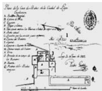
O Balneario de Lugo segundo un plano de 1812

dalgunhas transformacións no establecemento coas que pretendía acabar co estado de abandono existente. De aí as iniciativas para regularizar unha serie de normas hixiénico-morais que separaban aos pacientes por sexo, idade e enfermidade, os cadros horarios para a atención dos enfermos, os métodos de utilización dos baños e a decisión de mantelos abertos durante unha tempada oficial que se estendía desde o 15 de xuño ao 30 de setembro.