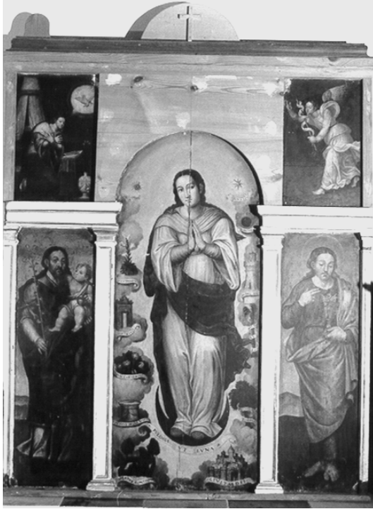
I. Retaula de la Immaculada (Església de la Mercè, Xàtiva).