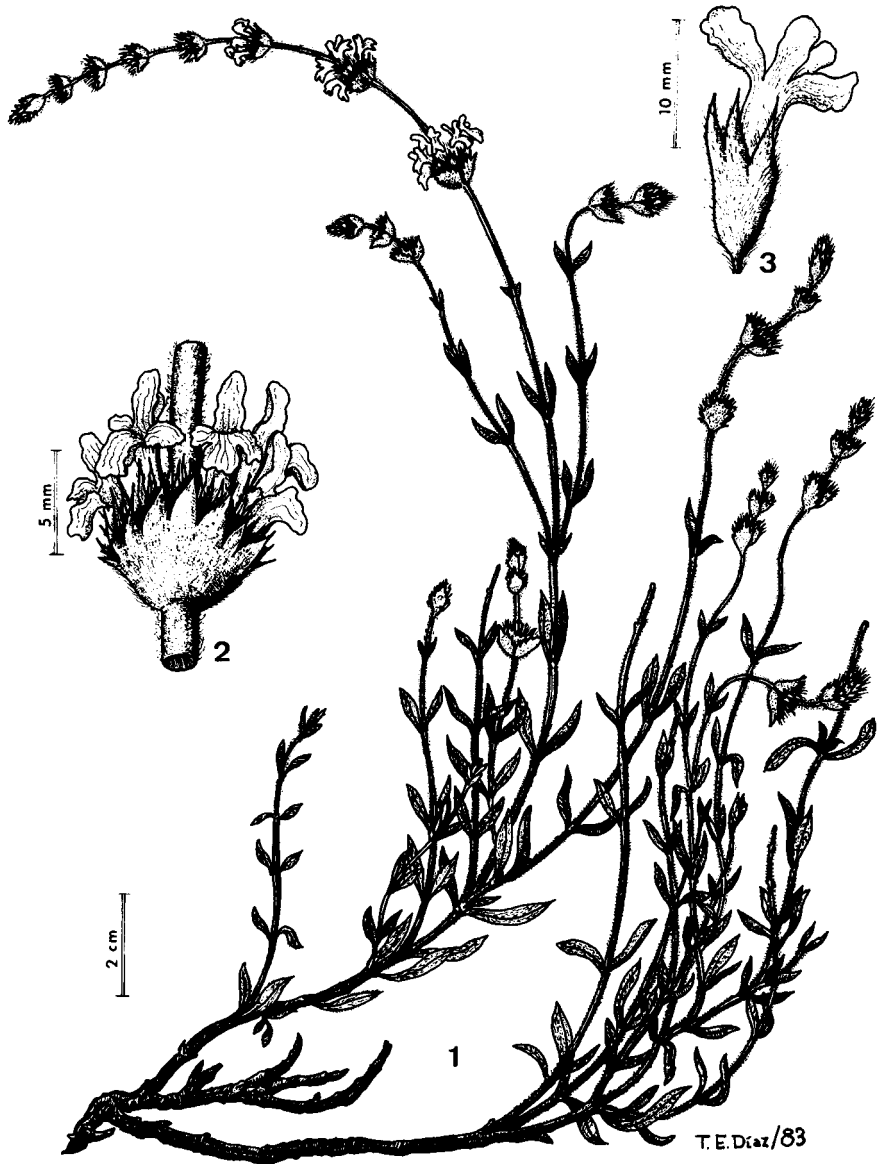
Fig. 1.— Sideritis hyssopifolia var. laxispica . 1. Aspecto de la planta. 2. Detalle de un verticilastro. 3. Detalle de una flor.