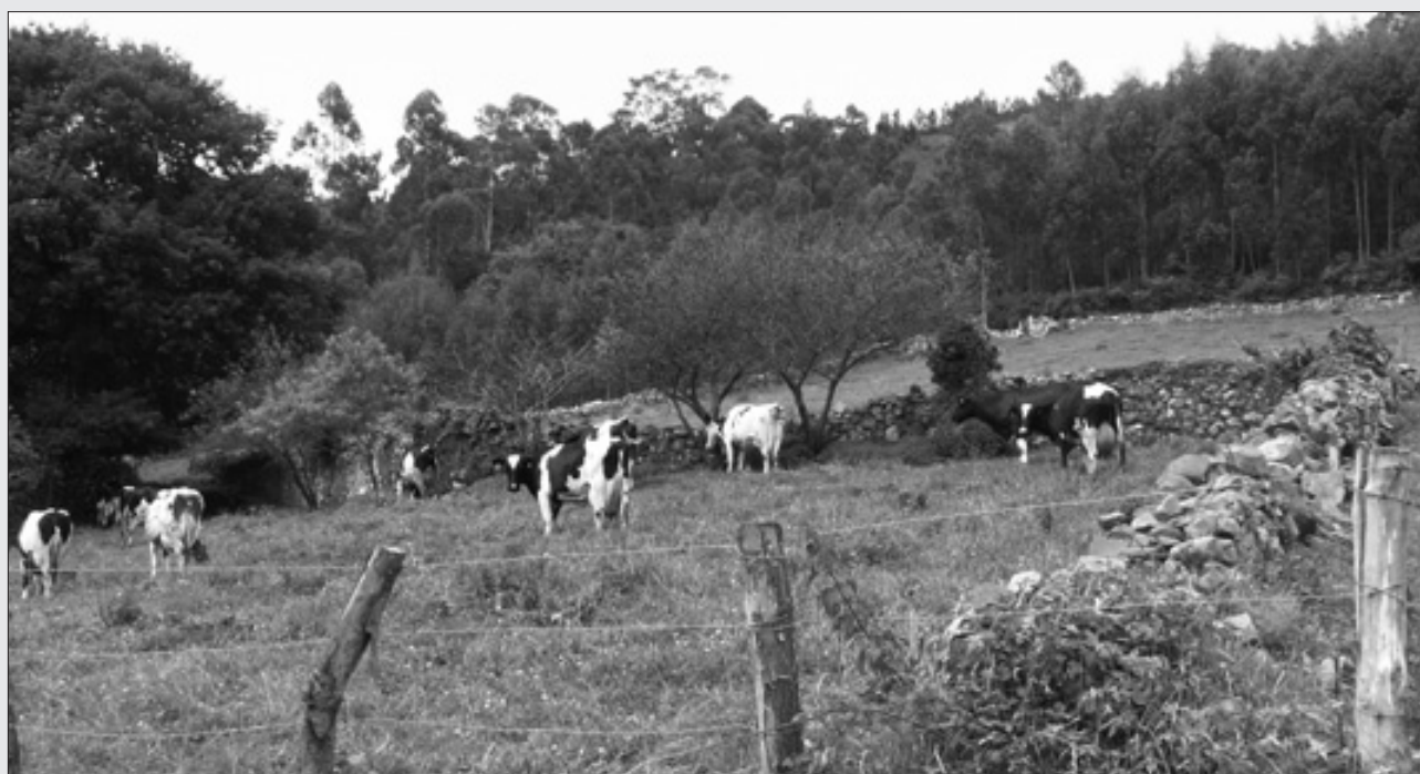
FINCAS CERRADAS DE PIEDRA EN LA COLLADA. J.I. PRIETO.