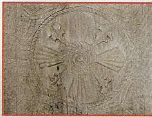
Recuperación de una panera en Parades