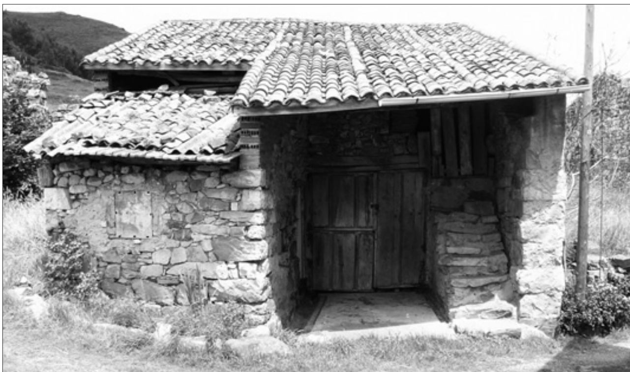
ANTIGUA VIVIENDA EN EL SUCO. J.I. PRIETO.

En la pregunta 22 del Catastro del Marqués de la Ensenada (CME) se recoge: ...y que no tienen noticia de que ningún vecino pague cosa alguna en particular por razón de Señorío después de la redención de dicho Concexo; si solamente los habitantes en el Lugar, y Braña que se dice de Cogollo de la Parrochia de San Juan de Trasmonte por el establecimiento de sus moradas, y todos los Bienes raíces que comprende dicha