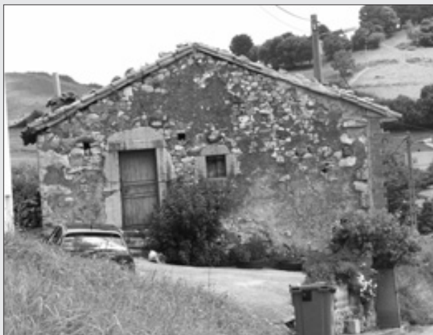
CASA EN EL SUCO DE TIPOLOGÍA ANTIGUA.