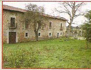
Menendo de Valdés... Palacio de Bolgues