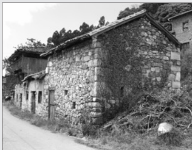
ANTIGUA VIVIENDA EN LA COLLADA. J.I. PRIETO.

Hay 25 vecinos que se dedican a la fábrica de carbón. Quedan como recuerdo de ello los topónimos Caleros,