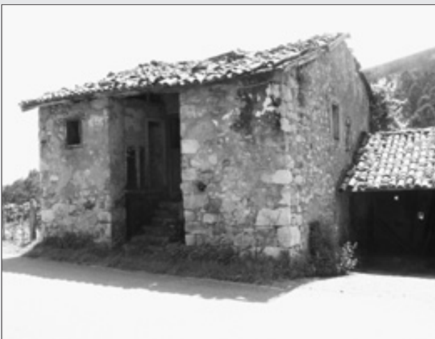
ANTIGUA VIVIENDA EN EL ROZO. J.I. PRIETO.