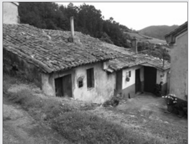
VIVIENDAS EN EL HORRO. J.I. PRIETO.