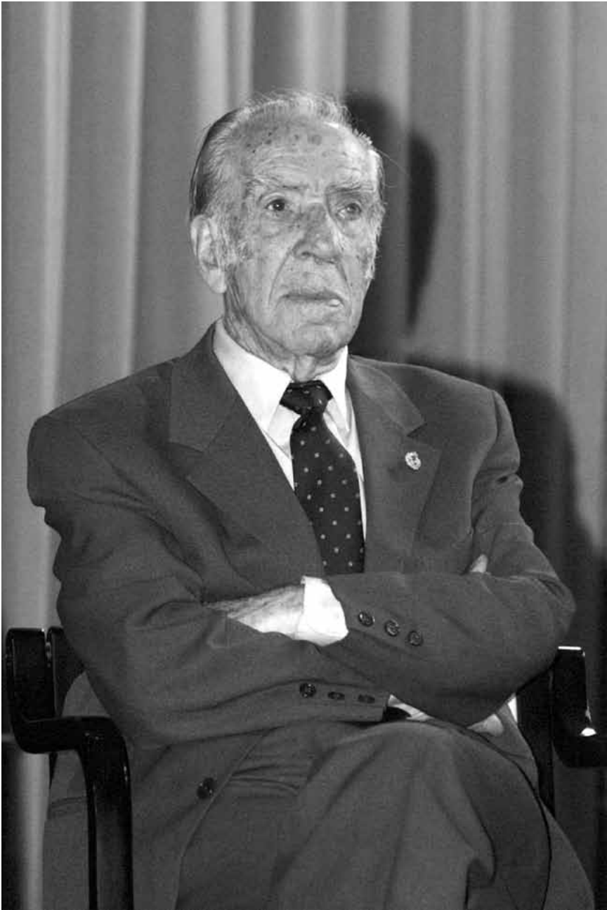
Elixio nun momento da homenaxe ós presos da guerra civil que lle tributou o Concello de Celanova no ano 2003.