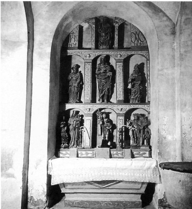
FIGURA 3. Retaule dels Sants Vells. Església parroquial de Sant Joan Baptista de Vallclara. Biblioteca de Catalunya.