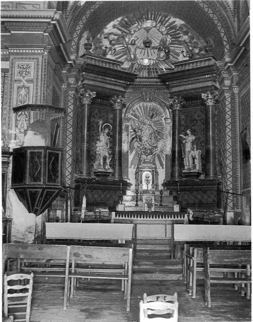
FIGURA 1. Retaule major. Església parroquial, Segura.