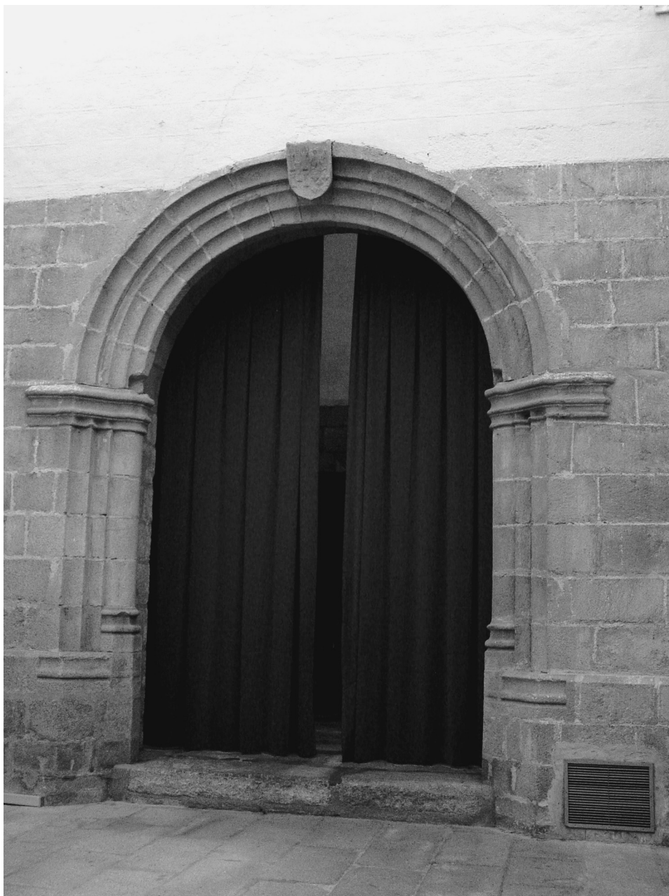
FIG. 2. Portada de acceso a la capilla desde el interior del templo monástico.