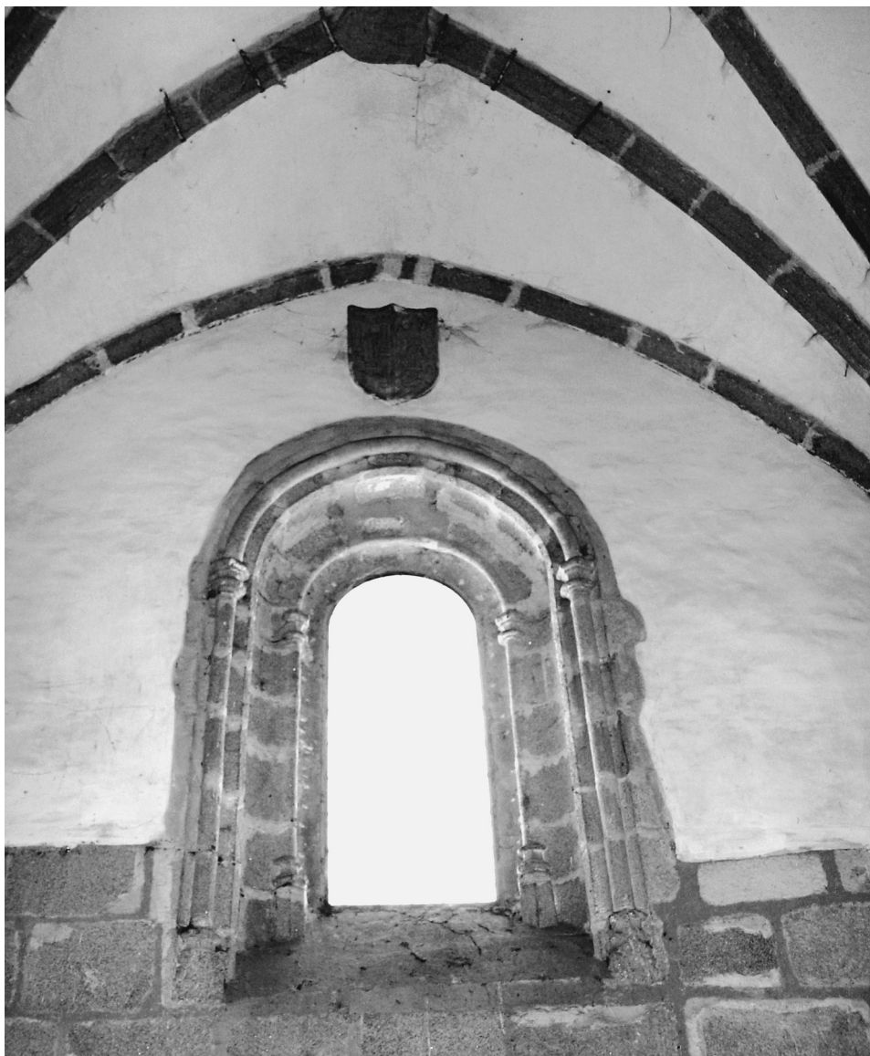
FIG. 4. Ventana del testero de la capilla.