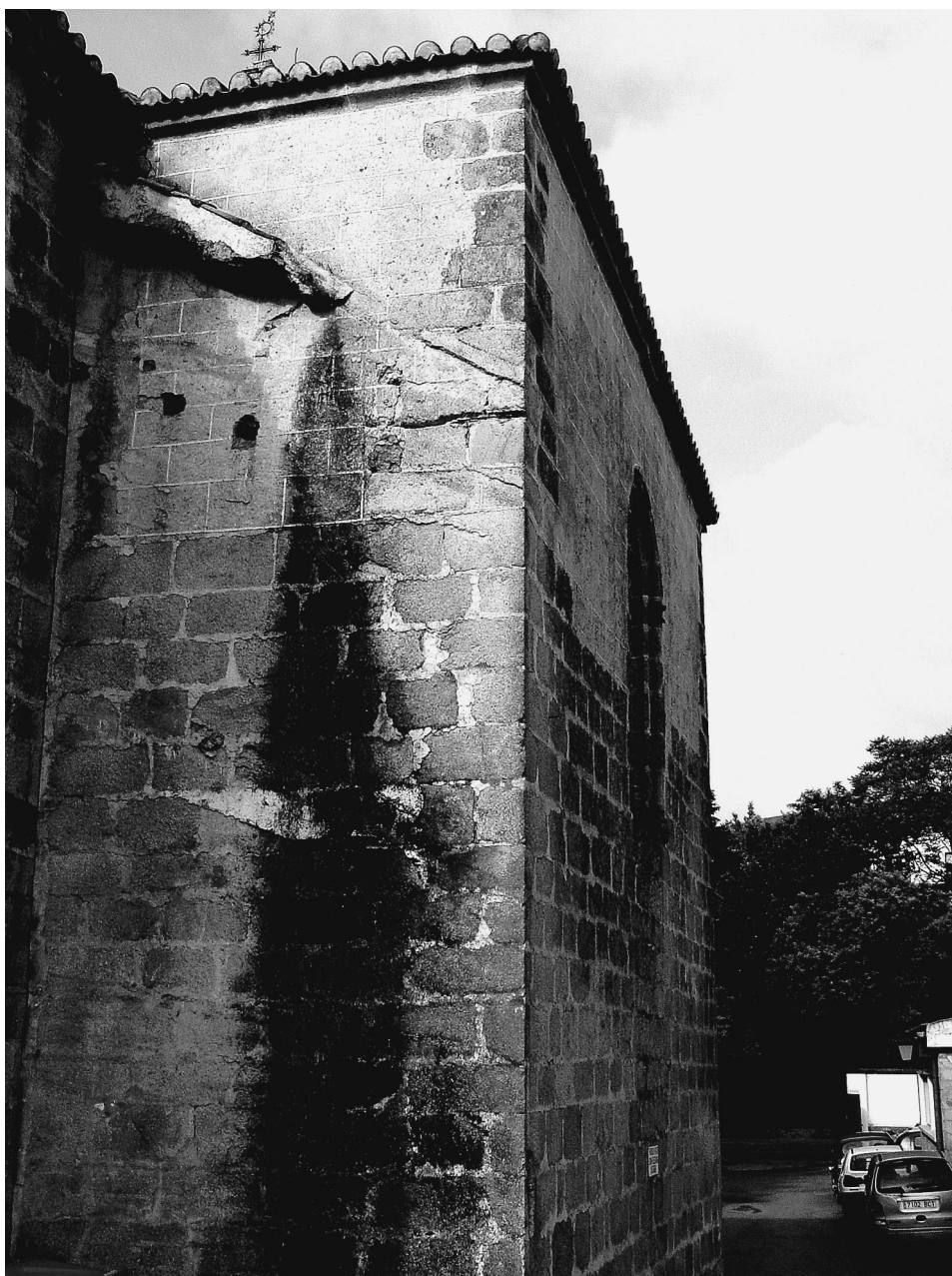
FIG. 1. Exterior de la capilla del Mariscal en el monasterio de San Francisco de Cáceres.