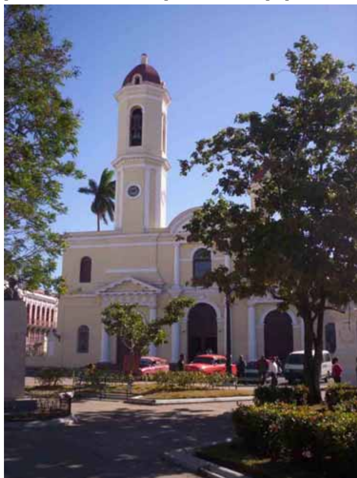
FIGURA 1. Iglesia catedral Purísima Concepción de la ciudad de Cienfuegos

héroe nacional, cuyo monumento preside la misma. Entre los importantes edificios públicos que se alzan alrededor de esta plaza está la iglesia catedral Purísima Concepción, cuya construcción fue iniciada en el año 1833, con la colocación de la primera piedra. En 1850 se levantó la primera torre con su campanario, la más pequeña de las