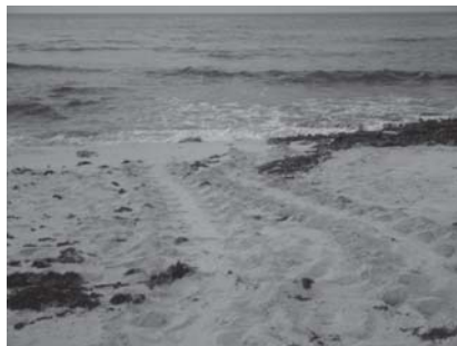
Figura 5. Rastro de tortuga blanca.

El tamaño, la huella y el tipo de rastro que deja cada una de las tortugas marinas al subir a la playa, es un indicio para saber de qué especie se trata. En el caso de la tortuga Chelonia mydas su tipo de huella es alternada, es decir, impulsan su cuerpo hacia delante con las aletas delanteras, mueven primero una y después la otra, formando una marca diagonal sobre el rastro dejado en la arena (fig. 5).