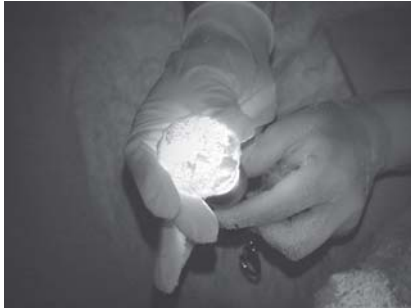
Figura 3. Huevo con 30 minutos de incubación.

llega a la madurez sexual aún más tarde, entre 20 y 50 años. La tortuga verde es reconocida como una especie fiel a su lugar de anidación, lo cual significa que una tortuga regresará a la misma playa cada vez que esté lista para desovar (Pritchard y Mortimer, 2000: 23-41).