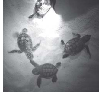
Figura 4. Crías de Chelonia mydas .