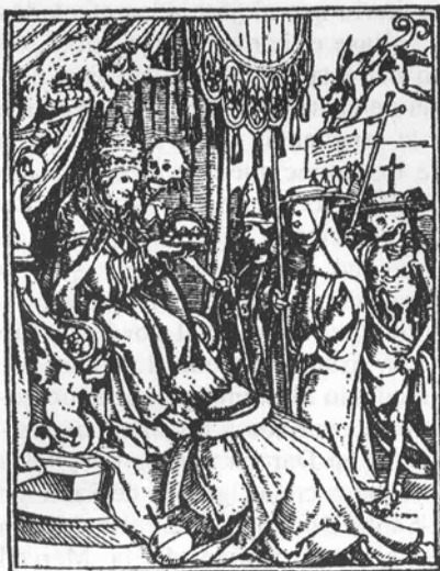
Hans Holbein. Las imágenes de la muerte , (primera edición de Lyon, 1538).

(24) Véase AMD, Act. Mun, 1549, 4 de oct; 1558, 9 de enero, 7 de junio; 1564, 13 de marzo; 1565, 2 de marzo, 18 de mayo, 6 de julio, 14 de septiembre; 1566, 19 y 21 de julio; 1589, 16 de junio; 1597, 19 de junio; 1628, 13 de octubre; 1647, 19 de septiembre, 20 de octubre; 1648, 11 de septiembre, 28 de septiembre; 1650, 18 de noviembre; 1651, 10 y 12 de agosto, 11 de septiembre, 29 de septiembre; 1652, 19 de julio; 1653, 25 de julio, 8 de agosto, 22 de septiembre.