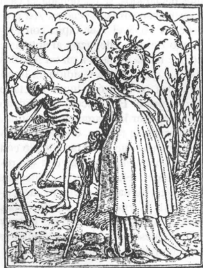
Hans Holbein. Las imágenes de la muerte , (primera edición de Lyon, 1538).

Estas dos líneas maestras convergerán en el establecimiento por parte de la ciudad de un servicio sanitario público estable por medio de las conducciones de médicos. Por medio de ellas, el Concejo establecía un acuerdo con uno o dos médicos, quienes se comprometían, a cambio de un salario, a visitar a todos los vecinos de la ciudad. La precariedad de la Hacienda municipal impuso que este dinero se recaudase mediante su re-