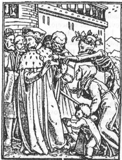
Hans Holbein. Las imágenes de la muerte , (primera edición de Lyon, 1538).

se vio en parte reducido al producirse la ocupación de las tierras de Montalbán y Teruel, que permitió a Alfonso II en 1177 otorgar el título de villa a la aldea de Teruel, conferirle un fuero propio y colocar bajo su jurisdicción toda la mitad sur del territorio concedido con anterioridad a Daroca en su fuero.