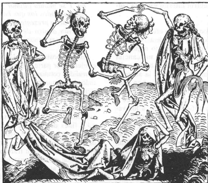
H. Schedel, Liber chronicon , Nuremberg, 1493.

tada y sospechosa. Si juran que no, se les deje entrar no entrando ropas algunas sino aquellas que se averiguen que vienen de parte donde no hay sospecha de peste ni otro mal contagioso» (33).