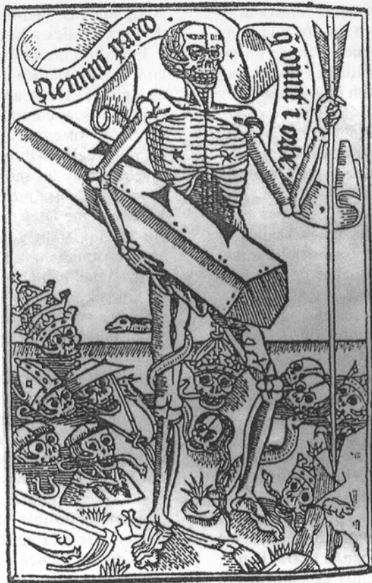
El libro de las cuatro postrimerías. Barcelona. Instituto Municipal de Historia.

el número de habitantes sino el de fuegos o unidades familiares no exentas obligadas a contribuir. El trabajo con esta fuente plantea varios problemas. El primero, establecer un coeficiente multiplicador (11) de entre