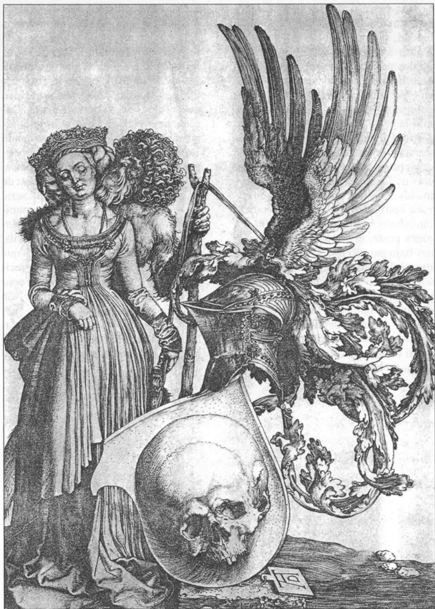
Alberto Durero, El blasón de la muerte , 1503.