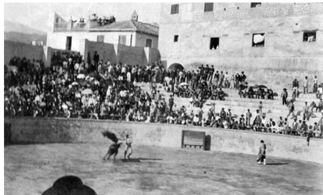
Plaza de toros de Vélez-Málaga a principios de siglo.