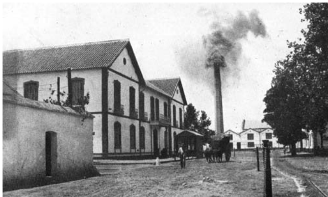
Casa de Larios. Fábrica de Torre del Mar