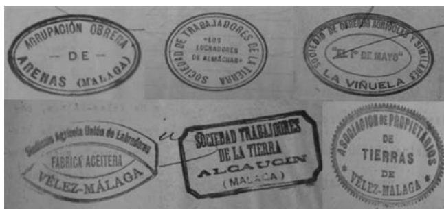
Sellos de Sociedades Obreras y Patronales

Segundos después, se sintieron varias detonaciones de petardos lanzados desde el exterior con el fin de alarmar a los espectadores. Las explosiones provocaron tal algarada que tuvieron que suspender el acto.