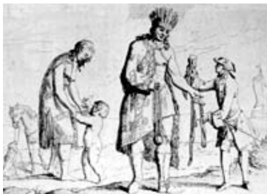
Imagen 2. Ilustración de la obra de Dom. Pernetty.

Tampoco los ingleses se libran del yerro. Hawkesworth incluye en su Diario del viaje alrededor del mundo , gráficos en los que se comparaba la estatura de los patagones con la de los europeos, siendo el resultado grotesco: las rodillas de aquellos llegan a la altura de éstos, acabando por duplicar su estatura 8 . Eso llevaría a estos indios a medir más de tres metros.