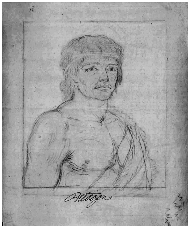
Imagen 4. Del Pozo, Patagón . Colección Malaspina, Museo Naval de Madrid, MS 1725 (9).

modo mucho más realista a estos nativos 13 . Malaspina incluso llegaría a enviar a España huesos presuntamente humanos de gran tamaño para que fuesen estudiados por la Real Academia de la Historia. Clavijo, Ramón Sarais y Agustín Gines-ta zanjarían la cuestión dictaminando su procedencia no humana 14 .