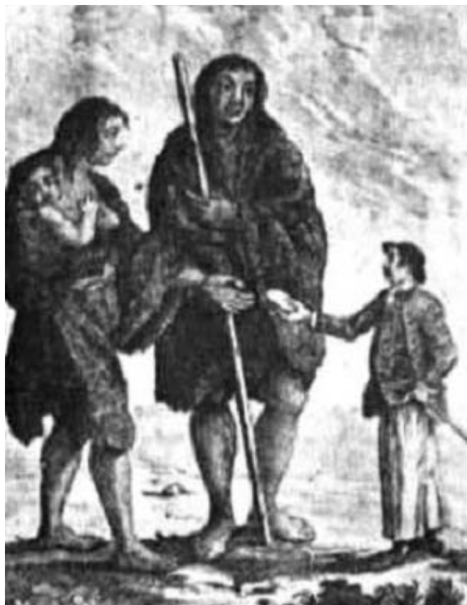
Imagen 3. Ilustración de la obra de Hawkesworth.

de “patagones”: “Abbiamo avuto la fortuna di trovare in queste vicinanze i celebri Patagoni. Erano questi in numero di 60 famiglie (...) Il più grande di loro era di 6 piedi e sete pulgade e gli altri, quantunque un poco più piccoli, avevano le trazze d’omini giganteschi” 11 .