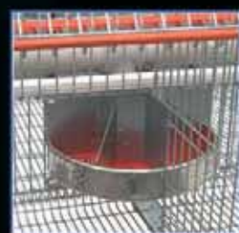
Comedero especial "Sinfin" Fácil racionamiento.