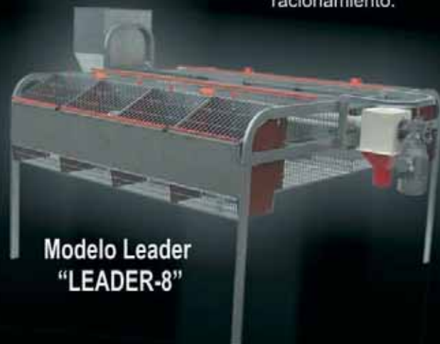
Modelo Leader "LEADER-8"