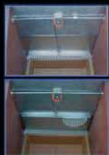
Control de lactancia automático