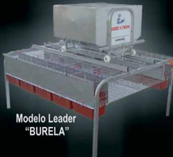
Modelo Leader "BURELA"