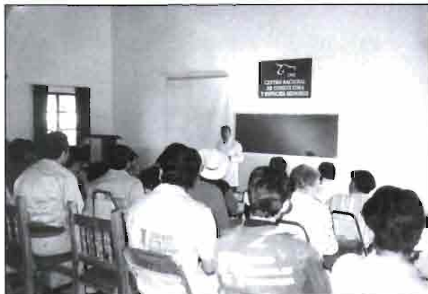
Asistentes al 2º curso de cunicultura empresarial.