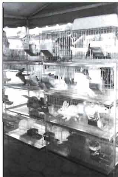
Detalle de los animales expuestos.