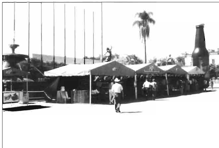
Exposición cunicola en Zapopan

del evento quien, junto a sus compañeros cunicultores, ofrecieron un exponente de seriedad y calidad al mayor nivel.