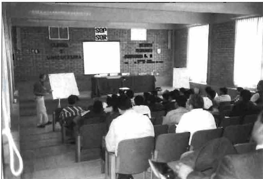
Sala de Actos durante el seminario