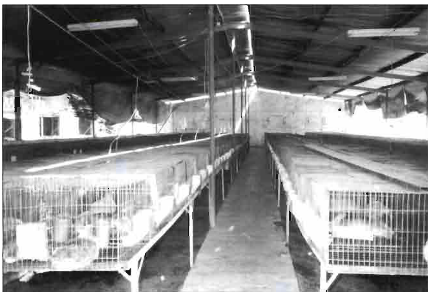
Granja cunicola de D. Rogelio Valdez.

suponga algún ingreso adicional a las economías más débiles.