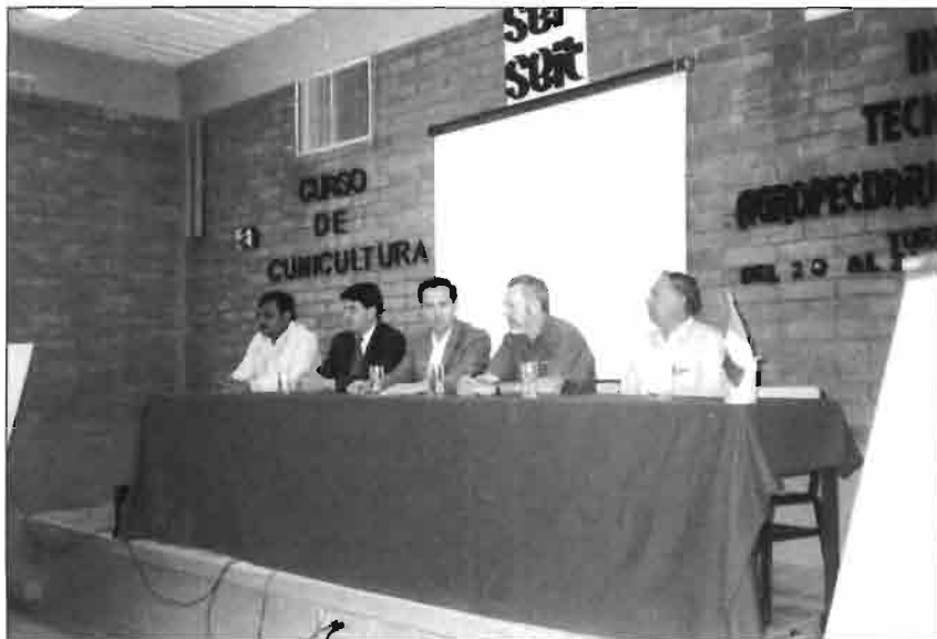
Mesa presidencial del seminario en Torreón.