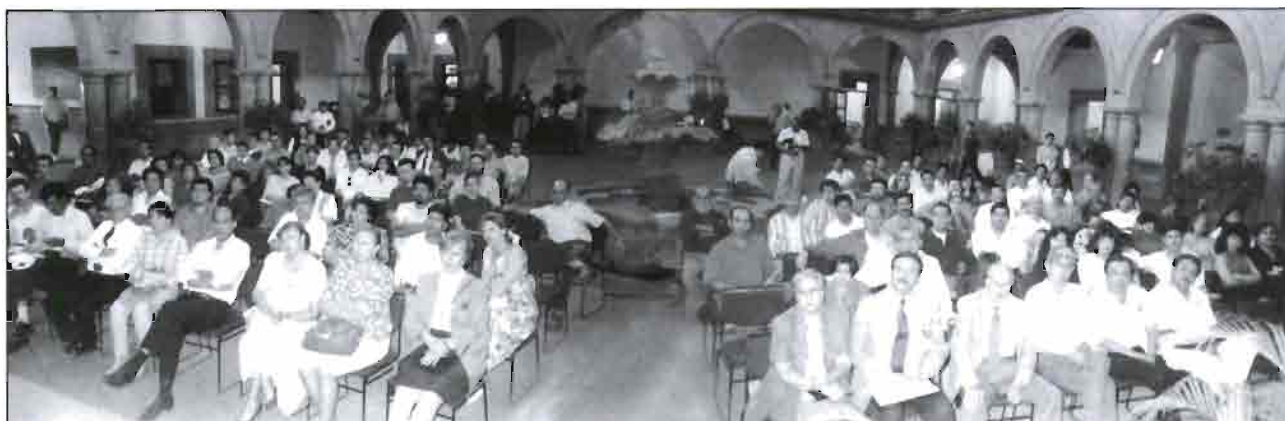
Público asistente a la Jornada Técnica