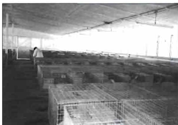
Nave de Maternidad.