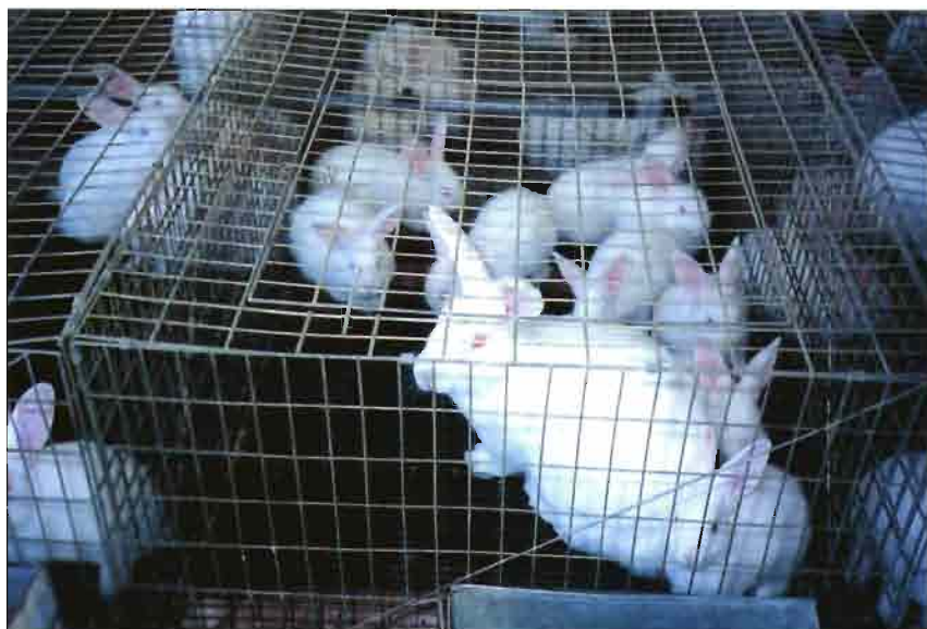
Hembra NZB con su camada

Economía, Fisiología, Planificación y Curtido de pieles.