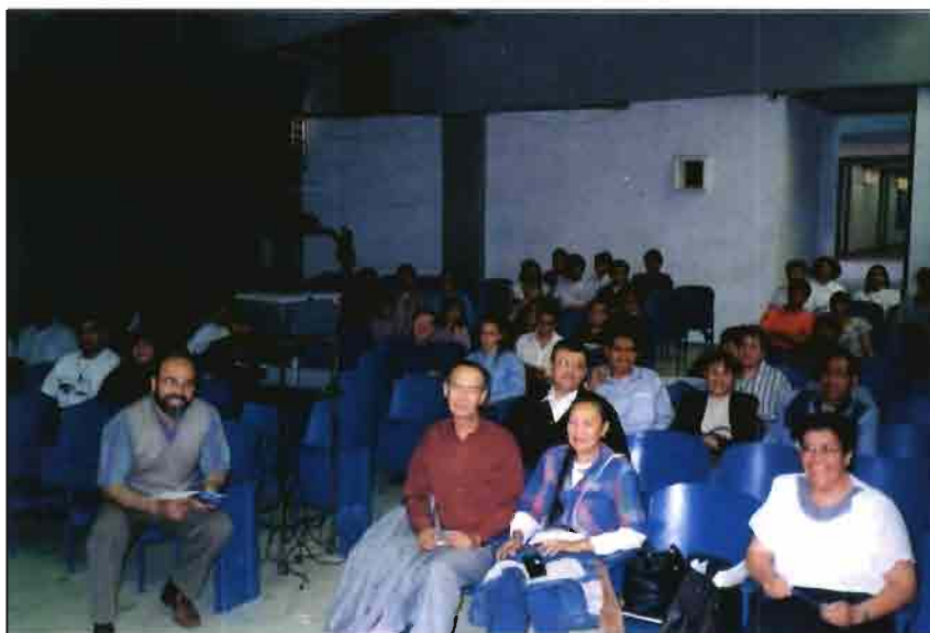
Publico asistente a la conferencia de Cuautitlan (Edo.México)