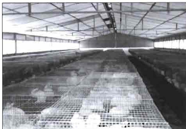
Vista interior de una nave de engorde