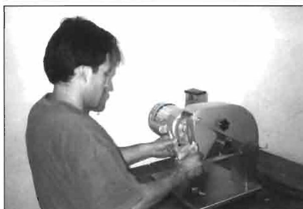
Detalle del troceado manual de las canales de conejo para la preparación de bandejas destinadas al mercado detallista y restaurantes.