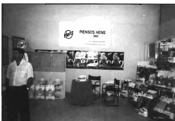
Productos para cunicultura y piensos de HENS, S.A.