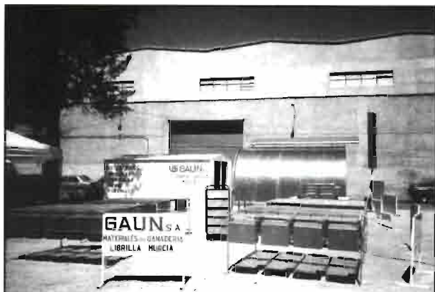
Exposición de material de GAUN, S.A.