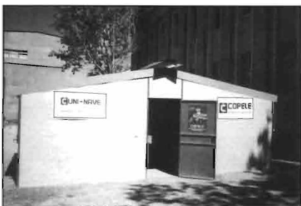
Montaje modular CUNINAVE expuestos por COPELE.