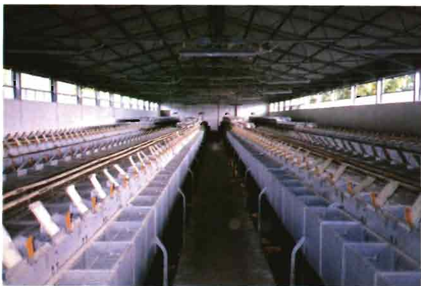
Interior de una nave. Obsérvese la ventilación natural alta en los laterales. Única abertura.