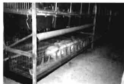
Detalle de las jaulas de gestación y reposición (Extrona) situadas debajo las Jaulas-Hembra. (Granja P. Paolo, Latina.)

— PG-600 (Intervet), mediante la aplicación de 40 UI de PMSG + 20 UI de IICG y previamente en suero glucosado; otros aplican 4 ml. de producto que contienen 66 UI de PMSG + 33 UI de IICG.