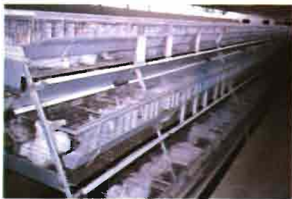
Jaulas dispuestas en California de tres pisos para el engorde. (A. Giordani.)