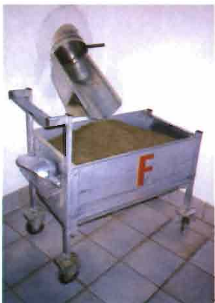
Carro para el pienso y salida del silo.