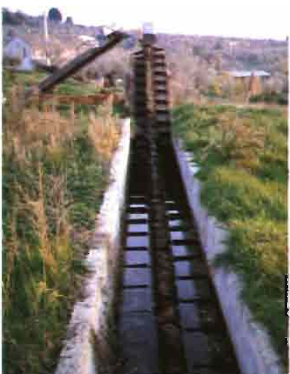
Canal mecanizado para el transporte de las deyecciones. (Granja Orlandi, Veneto.)

— Foligon (Intervet). Frasco de 5 ml. mezclado con Vitalox con 245 ml. Vitatox (producto vitamínico, antitóxico y energético). De la mezcla de 250 ml., se aplican 5 ml., vía s.c., por hembra, lo que supone una aplicación de 20 UI de PMSG.