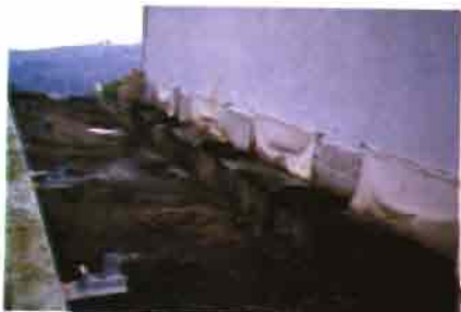
Salida de las deyecciones al exterior.