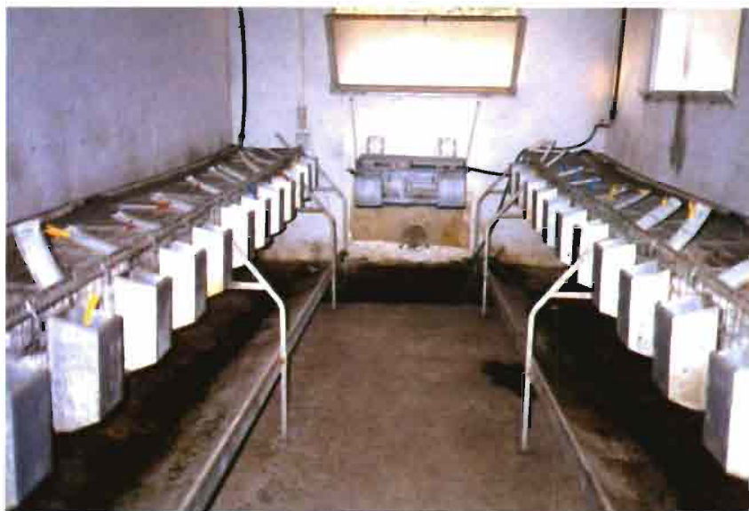
Local para los machos a los que se capta el semen para la I.A.