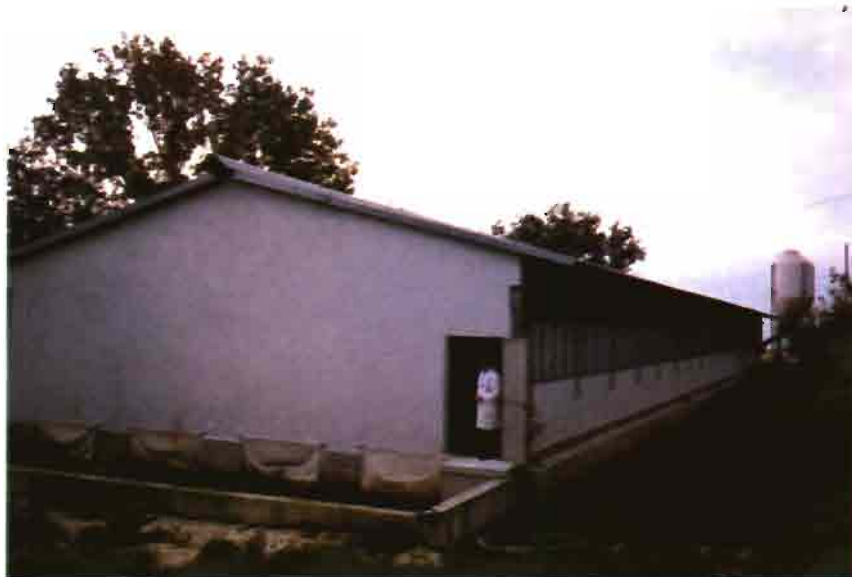
Vista exterior de una de las naveas visitadas. Granja A. Giordani.