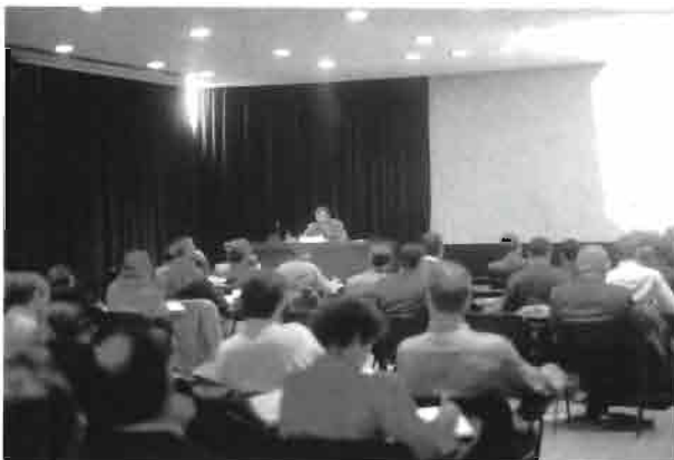
Aspecto de la sala 4 B durante la celebración de la Jornada Técnica organizada por ASESCU en EXPOAVIGA.

tatar en 103 de 532 granjas, es decir un total del 19,3 % de granjas visitadas. En muchos casos es-