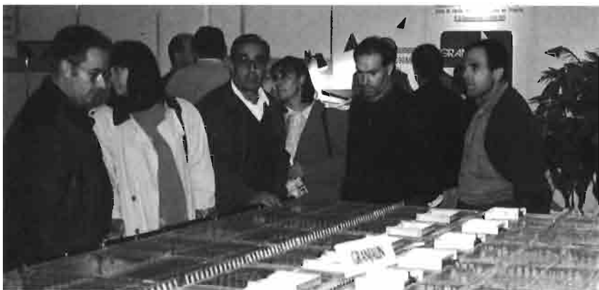
La exposición de conejos estuvo constantemente visitada y animada.

En el stand de la Asociación Española de Cunicultura, se presentó de forma destacada la «nueva revista», que como la mayor parte del sector ya sabe, se renovó hace un año. Las publicaciones cuniculas estaban faltadas de un órgano de difusión que compaginase la amenidad, con la información de primera mano, sin descuidar la técnica y los reportajes. Los lectores son cautos... y después de un año de «prueba» podemos decir que la revista está cada vez más consolidada. Fueron muchos los cunicultores que conocieron por primera