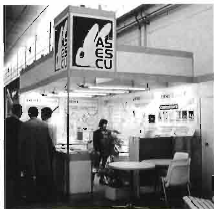
ASESCU lideró la cunicultura en la sección dedicada a esta especie, promocionando sus actividades.

CUNICULTURA FREIXER. Presentó dentro de su línea habitual, animales de diversas razas y