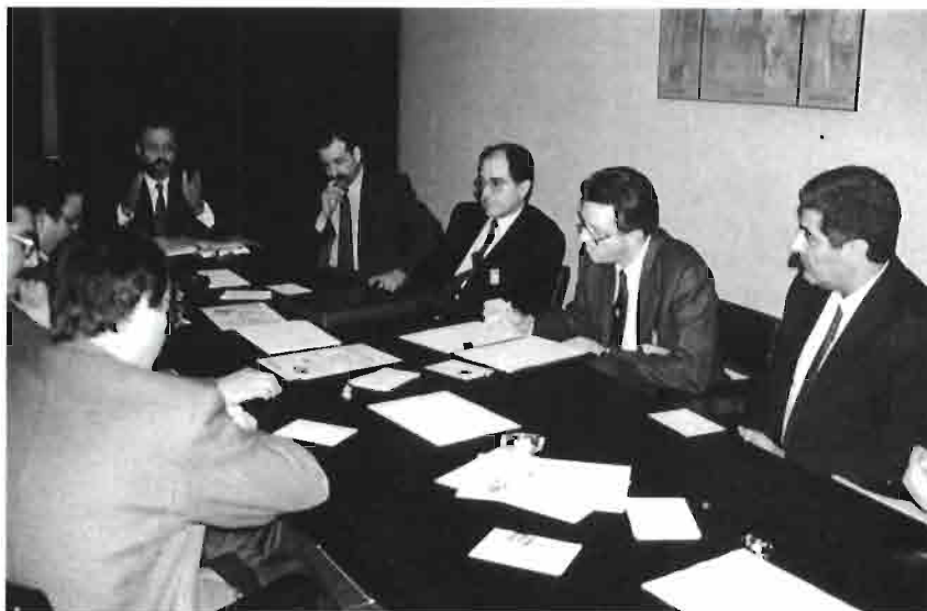
Reunión internacional de técnicos y Asociaciones Europeas de Cunicultores en EXPOAVIGA.

En el palacio n.º 2 —del Cincuentenario—, se concentró parte