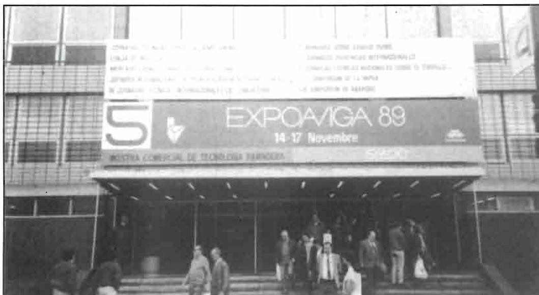
Entrada del Pabellón donde se celebraron las IV JORNADAS TÉCNICAS SOBRE CUNICULTURA

Durante la anterior edición del salón, en 1987, visitaron el salón más de 40.000 profesionales del sector, el 20 por ciento de las cuales procedían de distintos países extranjeros. De ellos, aproximadamente un 80 por ciento procedían de países comunitarios europeos.