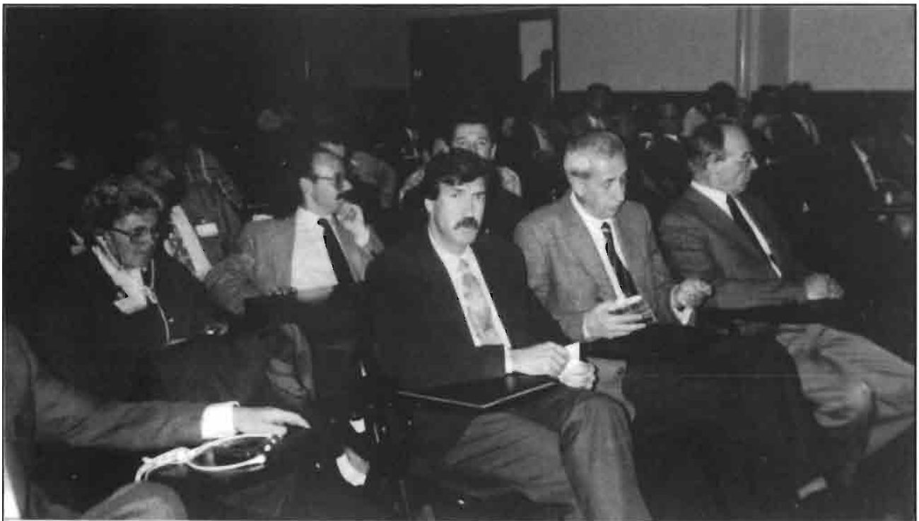
El público asistente a las IV JORNADAS TÉCNICAS SOBRE CUNICULTURA

una extensa oferta de novedades en tecnología avícola y ganadera el certamen consolidó su carácter de plataforma o punto de encuentro internacional que ha ido adquiriendo durante las últimas ediciones.