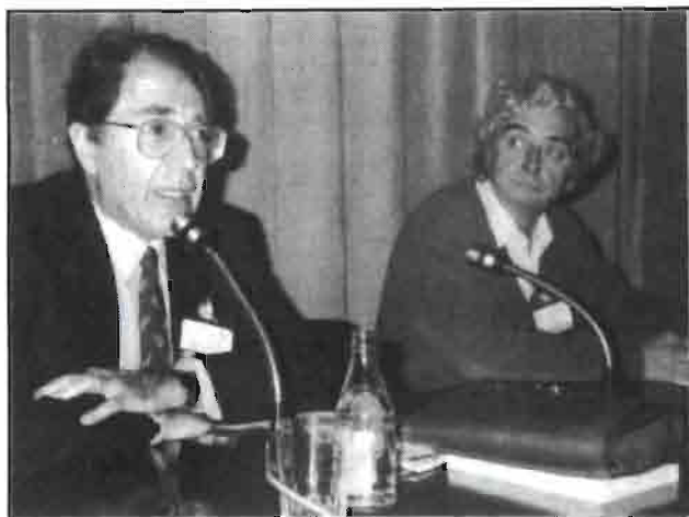
El presidente de la Asociación inaugurando las IV JORNADAS TÉCNICAS DE CUNICULTURA