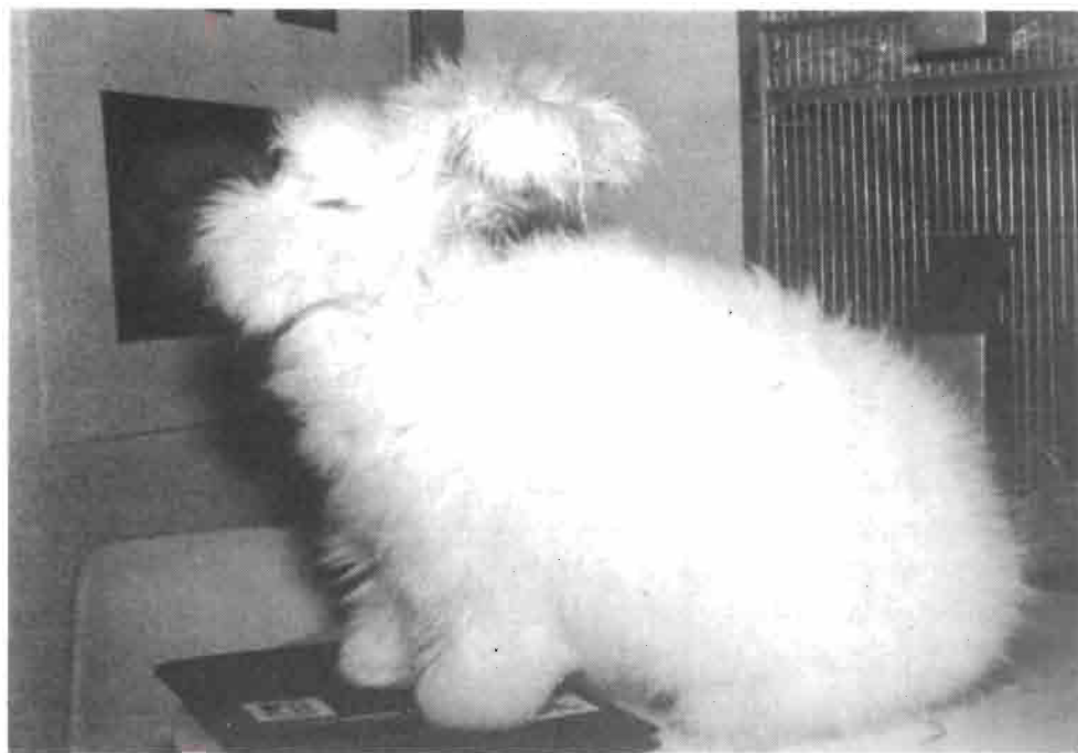
La máxima atracción la constituyeron los conejos de Raza Angora.