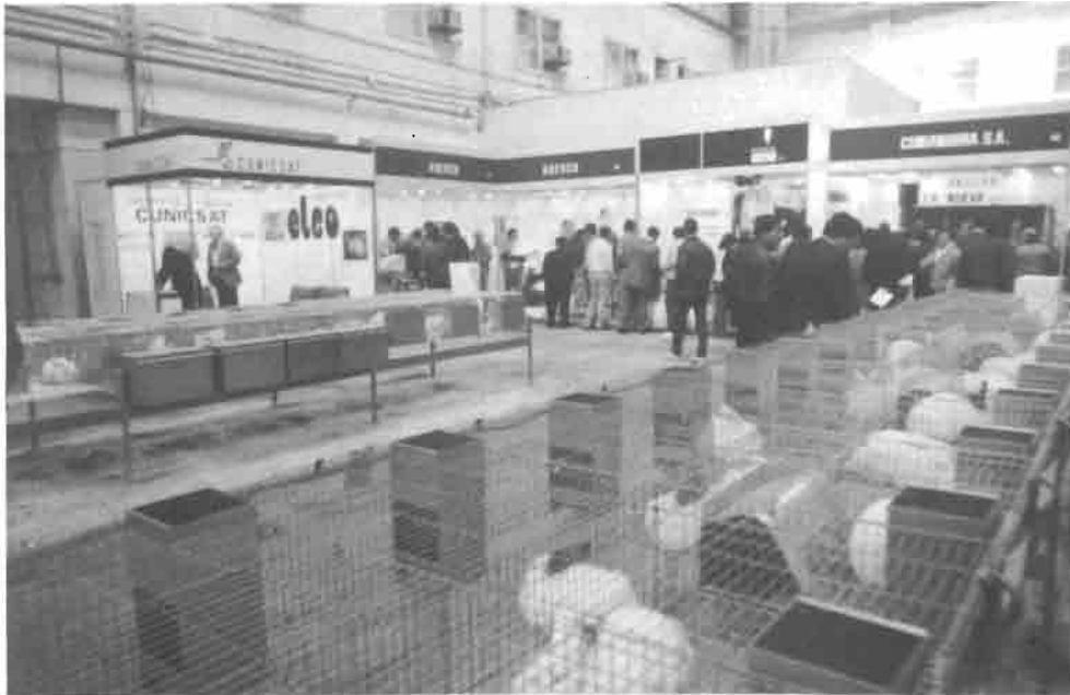
Detalles de la exposición de animales vivos, la cual alcanzó un notable éxito de participantes