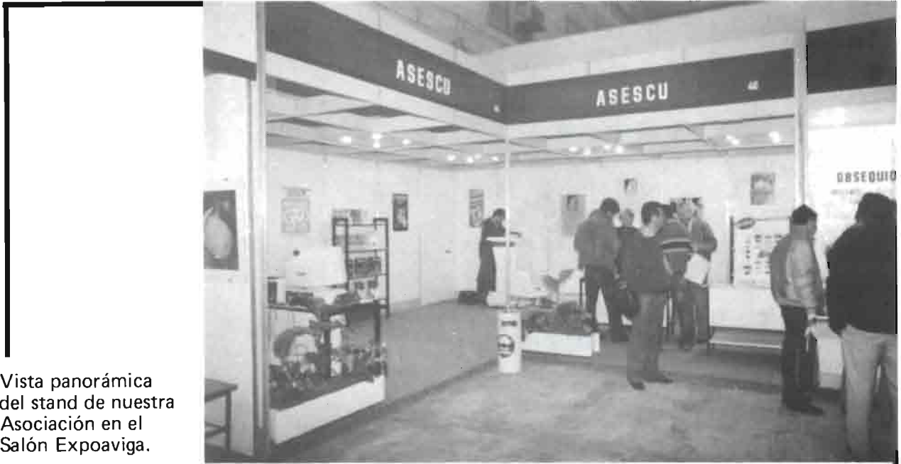
Vista panorámica del stand de nuestra Asociación en el Salón Expoaviga.