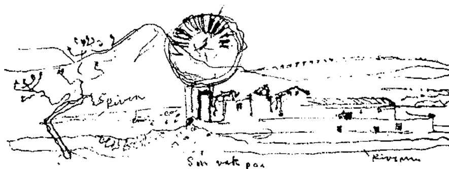
Paisaje español dibujado por Alvar Aalto, 1951.

los cincuenta en un movimiento pendular, que sirvió para marcar el camino de la homologación de aquella arquitectura en el contexto internacional y para lo que sirvió de guía la visita del maestro finlandés y su actitud ante el Monasterio del Escorial.