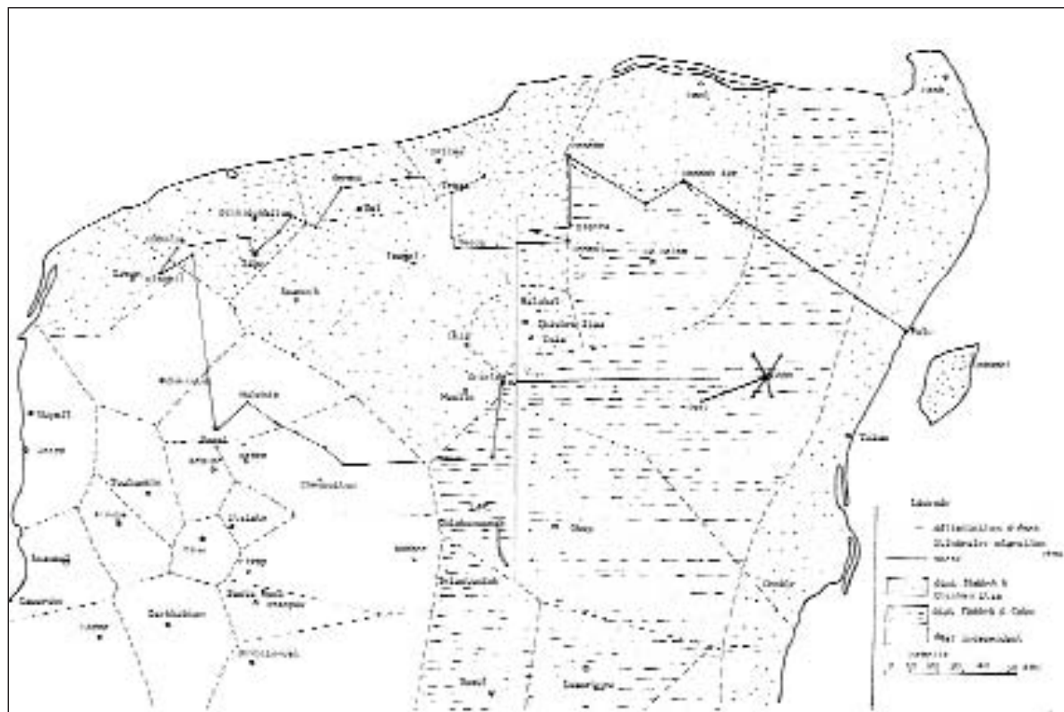
Figure 1. Fondation de Chichen Itza I. 9.12.0.0.0-9.13.0.0.0 8 Ahau (672-692).