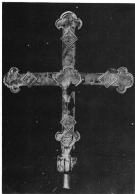
Fig. 1. Cabañas del Castillo. Cruz procesional, anverso.