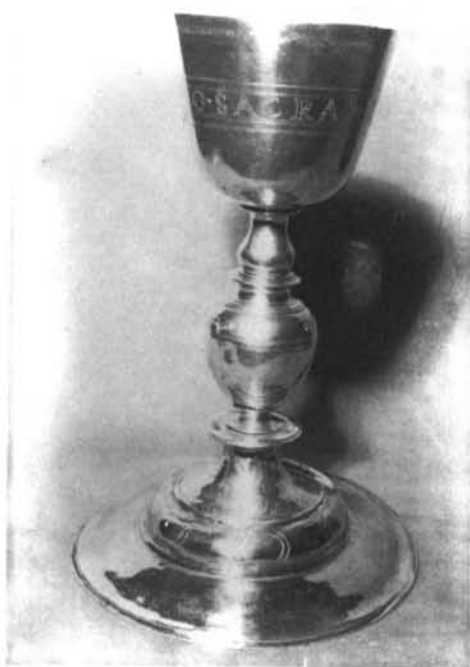
Fig. 5. Cabañas del Castillo. Cáliz.