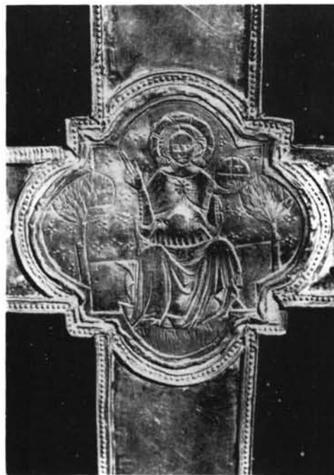
Fig. 4. Cabañas del Castillo. Cruz procesional, detalle del reverso.