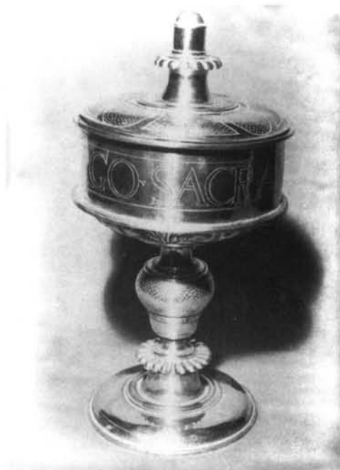
Fig. 6. Cabañas del Castillo. Copón.