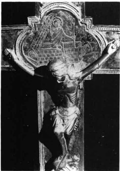
Fig. 3. Cabañas del Castillo. Cruz procesional, detalle del anverso.