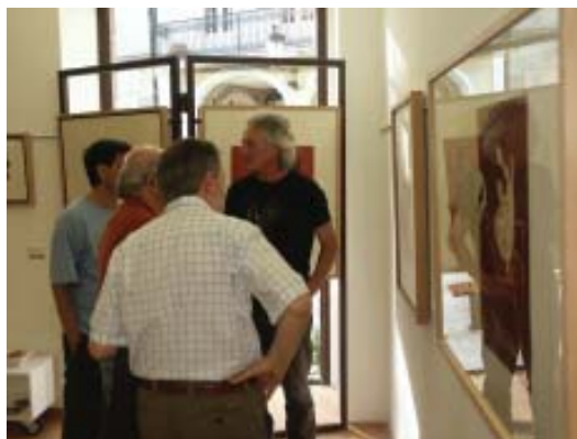
Exposición de Alfonso Costa.

ya desde su inauguración el 4 de julio con numerosos visitantes y aficionados al arte, como ocurre siempre con las exposiciones del verano. Prueba de ello son las entradas durante los dos meses de la muestra, con 3.259 visitas. No podemos olvidar tampoco el patrocinio de