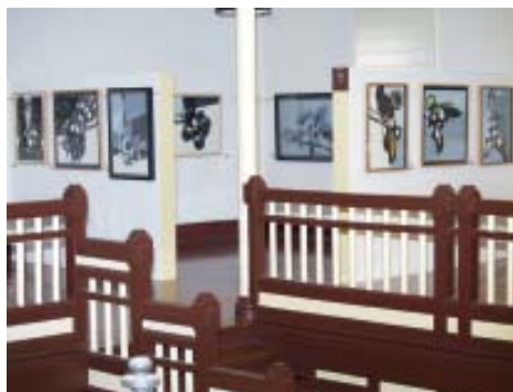
Exposición temporal de Javier Albar

Cursos teóricos y prácticos de dos meses de duración cada uno impartidos por un