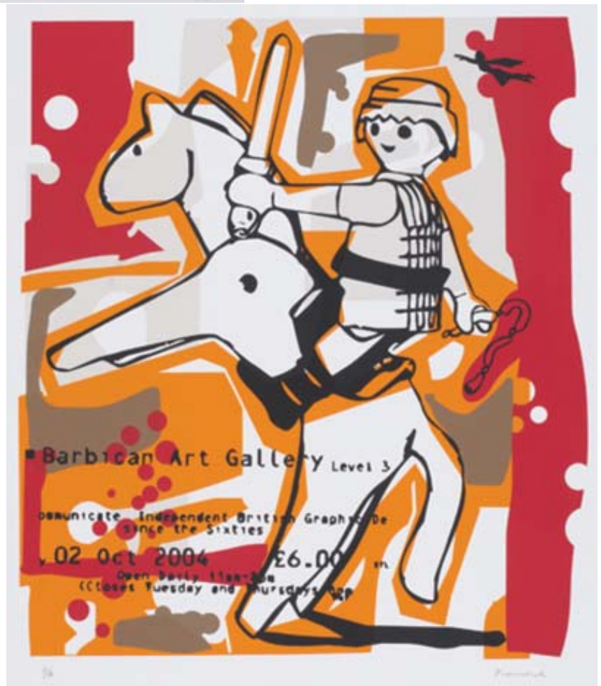
Héctor Francesch. Ecuestre II. Serigrafía.