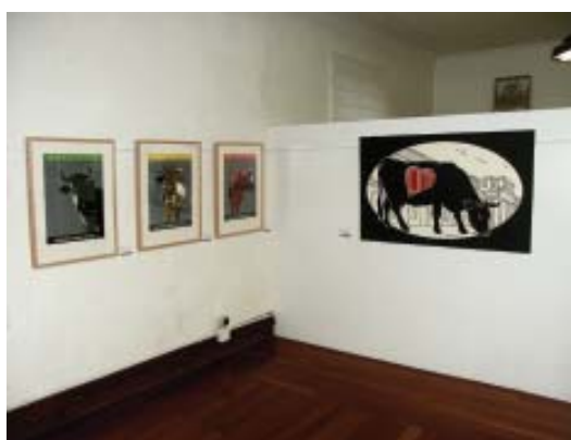
Exposición temporal de Ricardo Mojardín.