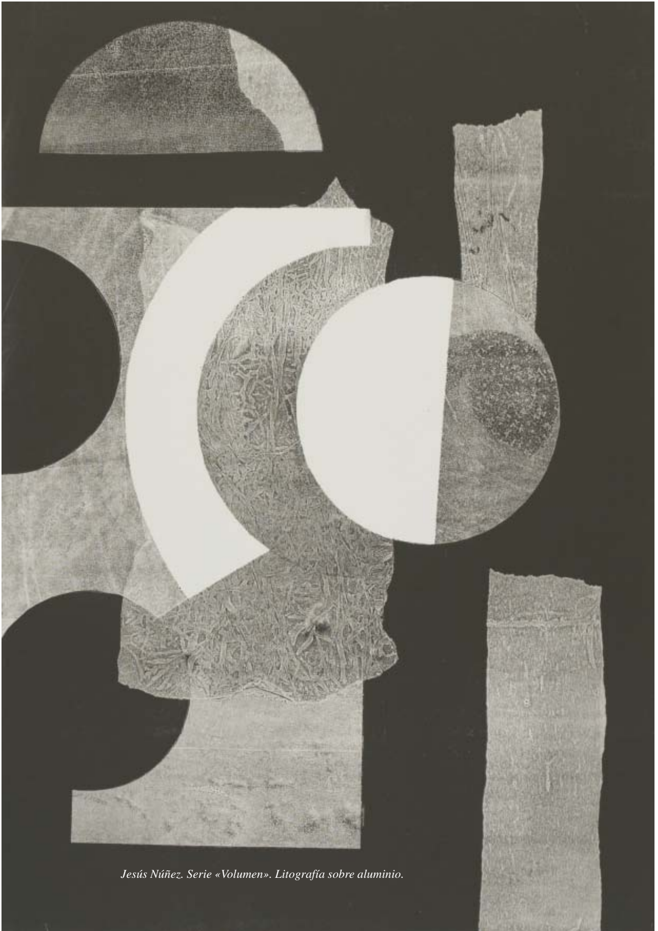
Jesús Núñez. Serie «Volumen». Litografía sobre aluminio.