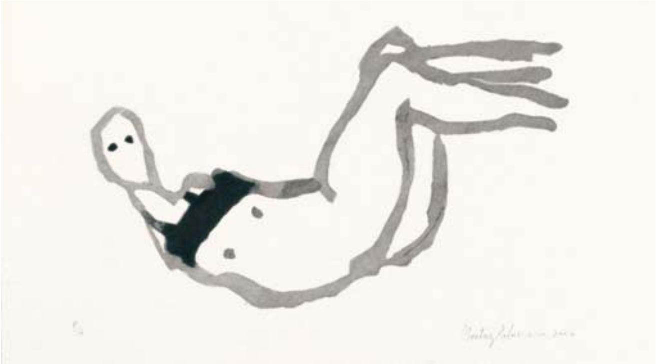
Beatriz Palomero. S/T. Aguatinta al azúcar. Moisés Yagües. Desconóctete. Aditivas.