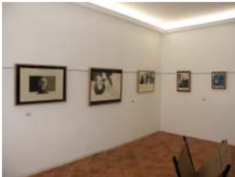
Exposición «10 años CIEC».