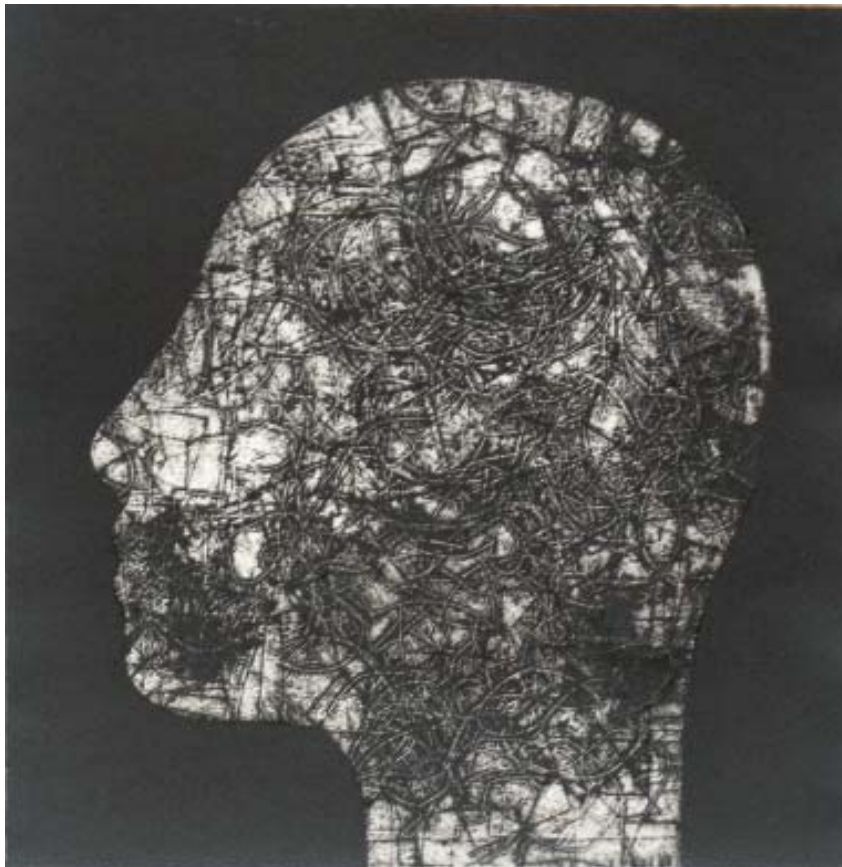
Anuario Brigantino 2007, nº 30