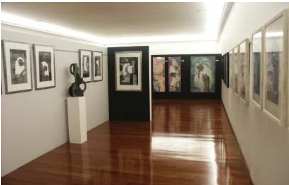
Sala Jesús Núñez.

Mientras tanto, en la primera planta del edificio comenzaban las obras de adecuación para albergar la Colección, que ve la luz en 2002, dedicando más de dos mil metros cuadrados a mostrar lo más variado del arte gráfico contemporáneo con obras de reconocidos artistas y jóvenes valores, donaciones y depósitos temporales, así como una sala destinada a mostrar la trayectoria artística del artista Jesús Núñez.