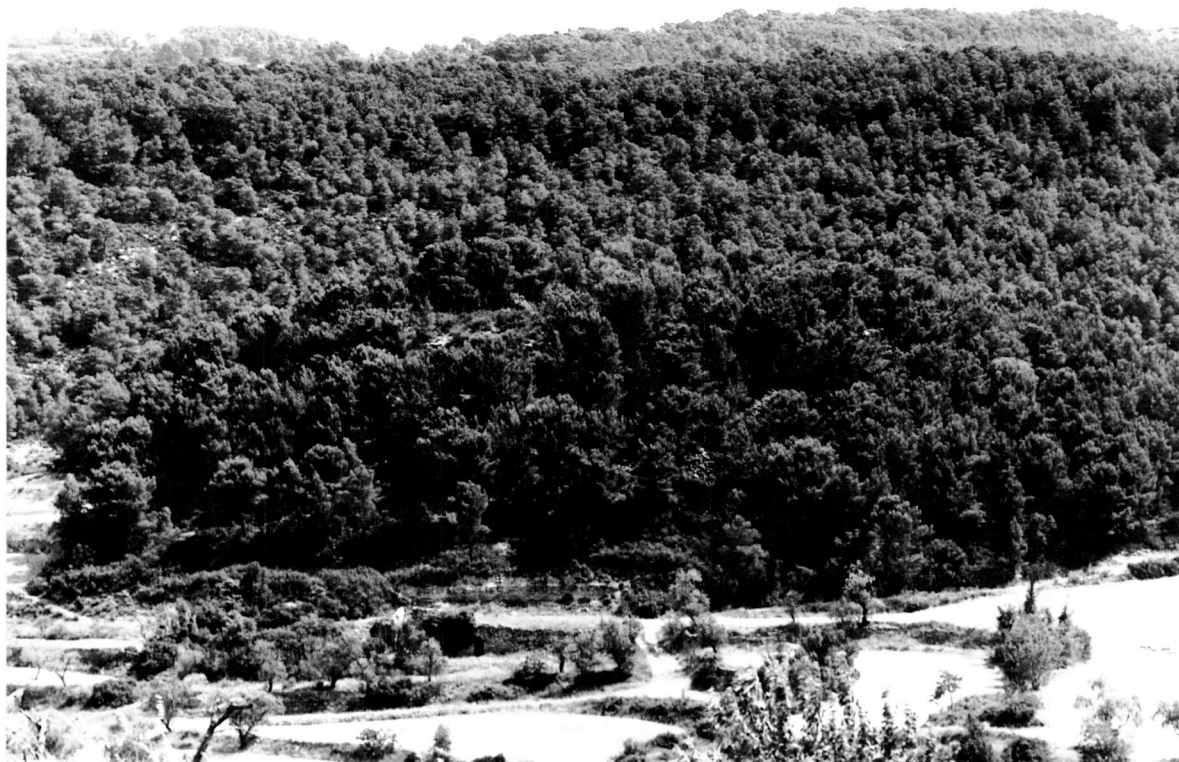
Tossalet, cobert de bosc, on era emplaçat Montesquiú.

servir les herbes com millor els semblava.