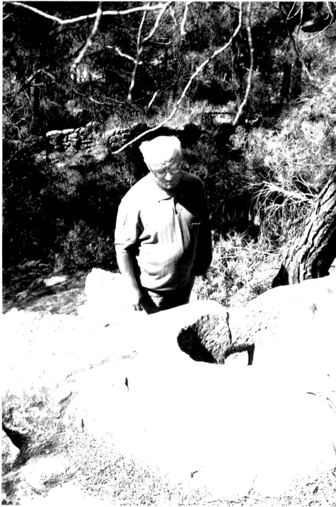
Imatge de la mesura de la quartera de Montesquiú.

Sobre el tema de les herbes: res treu el dret dels de Montblanquet de portar el bestiar a Montesquiú, car ordinations i arrendaments no s'estenen al dret de tercers.