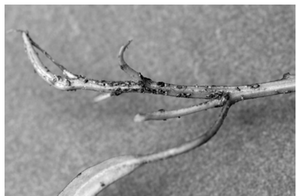
Figura 1. Ninfas de C. spatulata en brote de E. globulus

El análisis de los factores evaluados se llevó a cabo con el paquete estadístico SAS (SAS Institute, 2000). Antes de realizar los análisis de varianza, se comprobó que los datos se ajustaban a una distribución normal mediante el test de Kolmogorov-Smirnov. La comparación de medias se realizó con el test de Fisher's least-significant-difference con un Alpha: 0,05 y un valor crítico de T: 1,98.