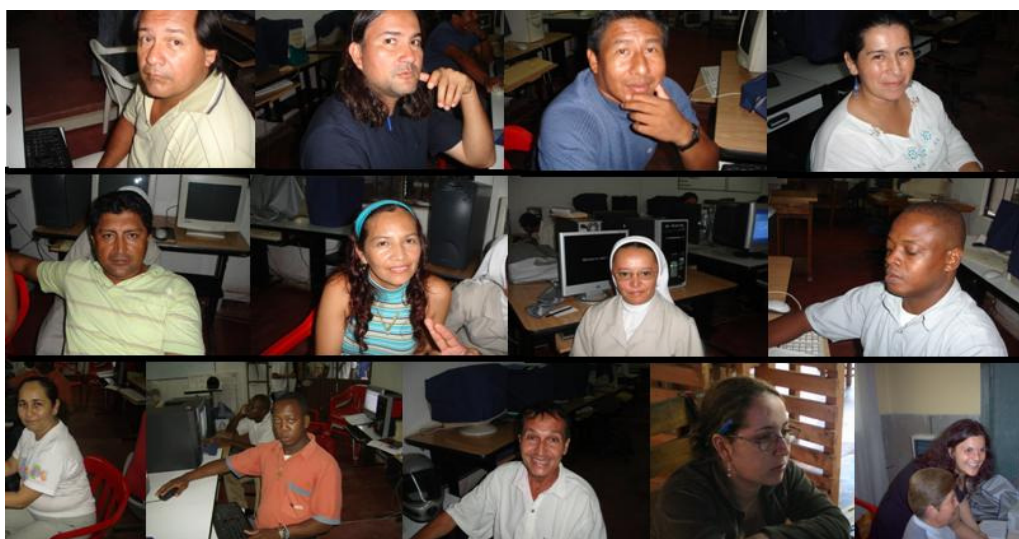
Imagen 1. Profesores de la Zona Urbana del Departamento de Guainía adscritos al Eje Región y Biodiversidad del Proyecto "Interculturalidad como elemento transformador de los procesos educativos".

Análisis regional. Para el análisis de la realidad regional se realizaron diversos talleres en relación con la identidad del habitante de Guainía, debiendo enfrentar la pluridiversidad étnica como una condición que imposibilita ver la identidad como un concepto único y excluyente. Se hicieron reflexiones frente al tema de la globalización y la conservación de la identidad cultural. Mediante ejercicios de cartografía social se examinó la prospectiva económica del departamento y el uso de los recursos naturales como soporte del desarrollo regional. Se consideró el tema de la pertinencia de la educación en el departamento desde la percepción que los educadores tienen del perfil del docente de Guainía, de los estudiantes y egresados y su correlación con las posibilidades que ofrece el medio en relación a calidad de vida y apropiación del territorio. Se socializaron experiencias de los docentes y estudiantes de la zona urbana en torno al afianzamiento de la identidad y el sentido de pertenencia regional. Se realizaron salidas de campo para identificar actividades bioprospectivas acordes al potencial del territorio y las prácticas culturales y económicas propias del departamento, que constituyen alternativas de trabajo legales para los habitantes, como la cría de peces ornamentales atendiendo a los términos exigidos por la legislación ambiental.