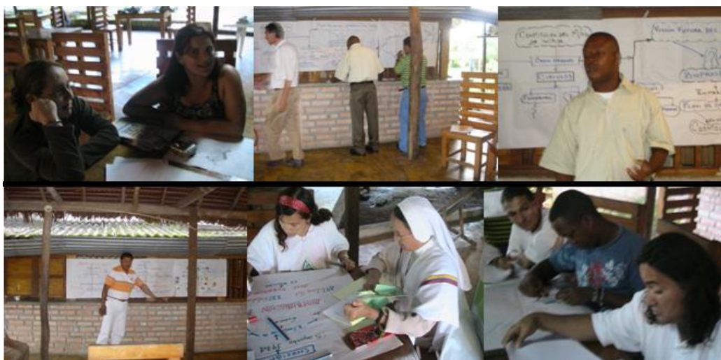
Imagen 3. Actividades didácticas desarrolladas en el Departamento por los docentes inscritos en el eje Región y biodiversidad.

Empleando herramientas informáticas como GoogleEarth, se realizaron inferencias frente al crecimiento urbanístico de la cabecera municipal: Puerto Inírida, y su desarrollo económico. Se realizó un taller de cartografía social en el cual se elaboraron mapas del territorio en perspectiva, considerando el desarrollo económico y urbanístico de la cabecera municipal.