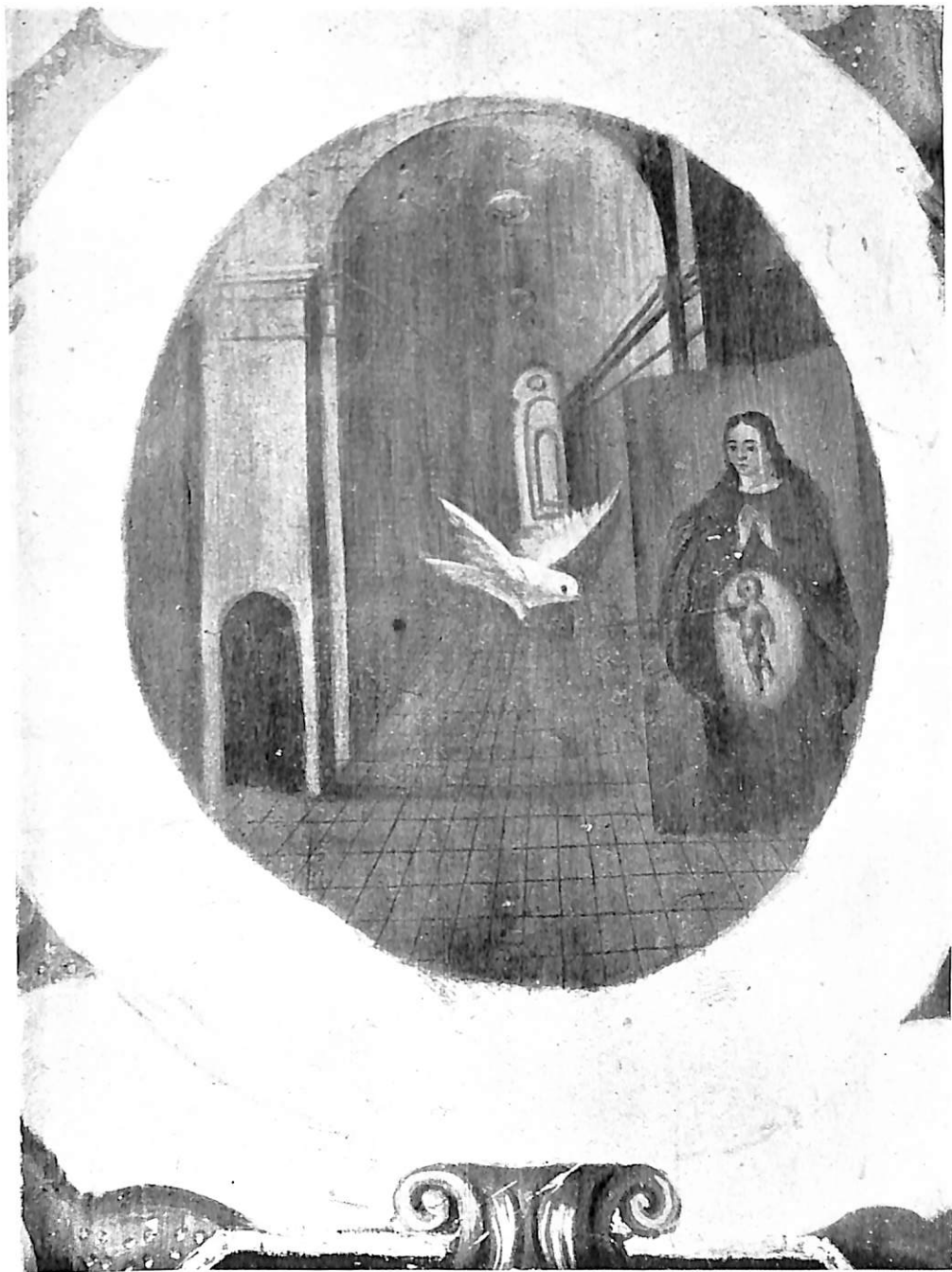
Lám. VII.—Pintura en un muro de la capilla de la Inmaculada de la Iglesia de la Cruz. Medina de Ríoseco.