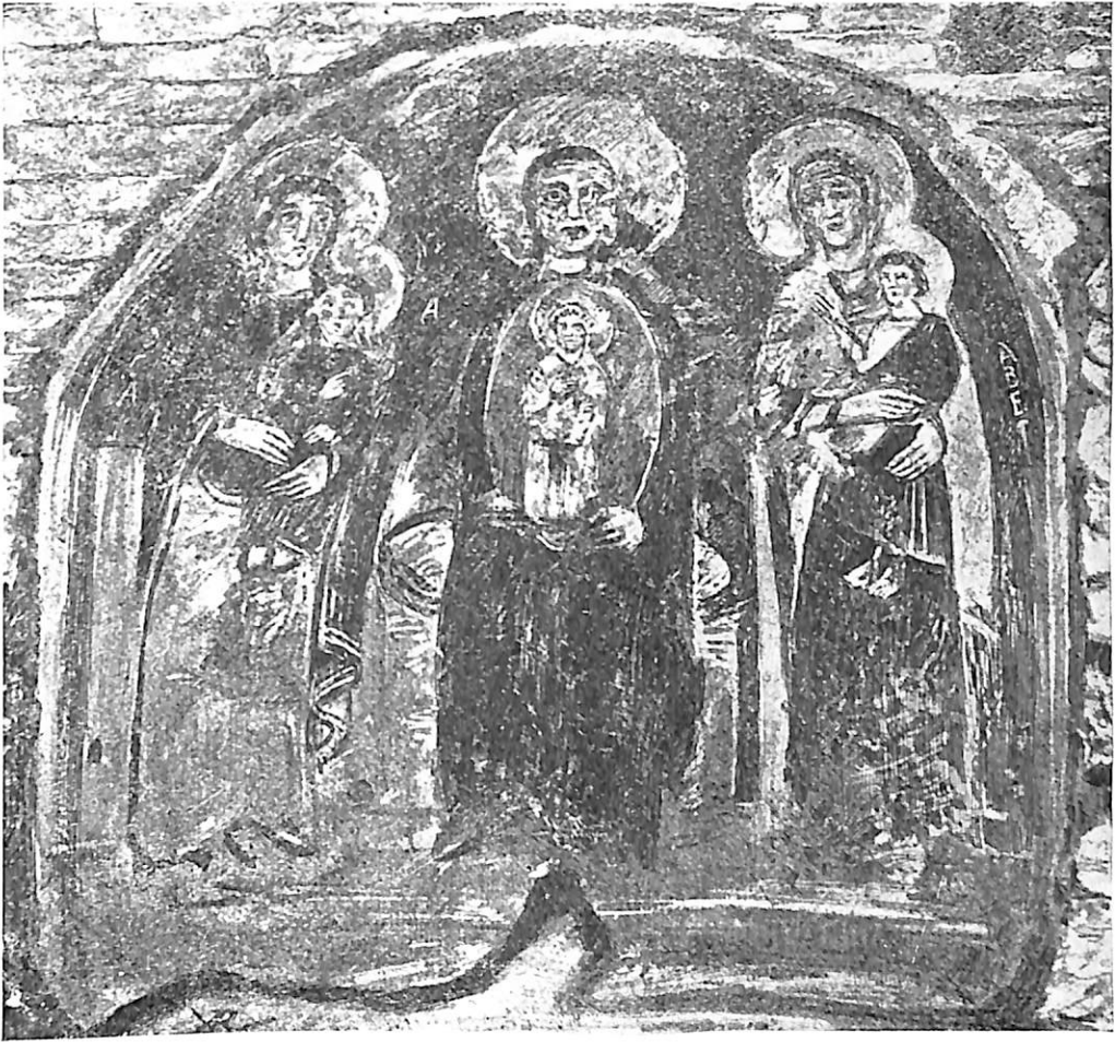
Lám. IX.—Fresco de las catacumbas. (Dibujo tomado de Cabrol et Lecrec Dic. d'Arch. Chretienne).