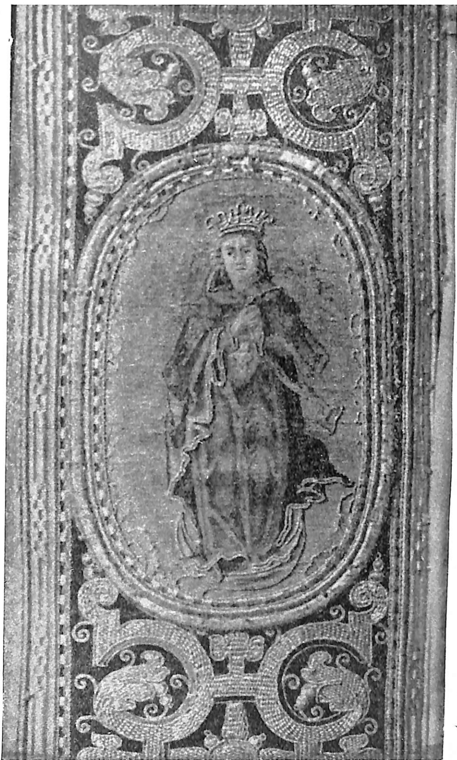
Lám. XV.—Barbadillo del Mercado (Burgos). La Inmaculada, en el medallón de una casulla.