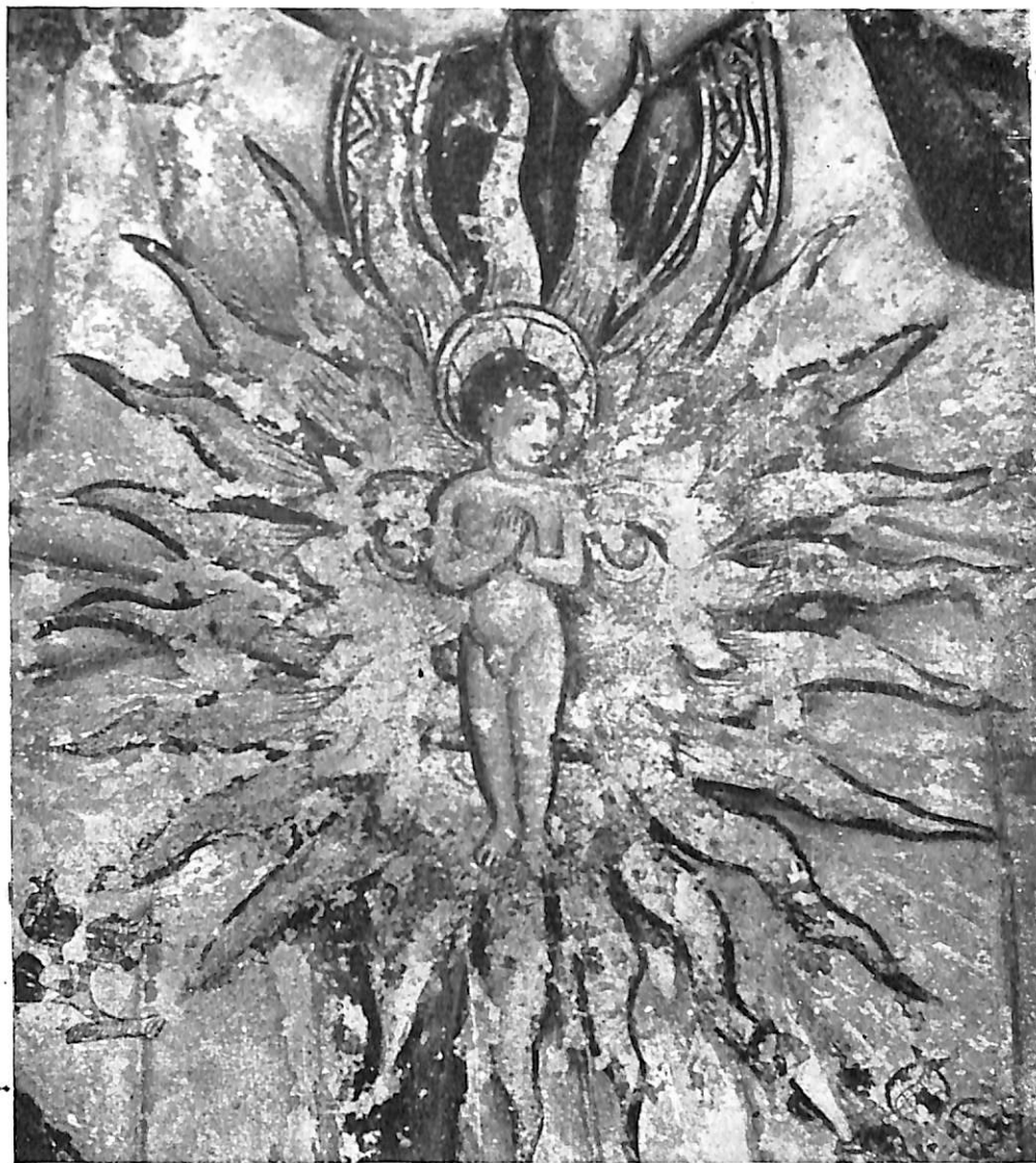
Lám. III.—El Divino Infante. (Detalle de la Inmaculada de Peñafiel).