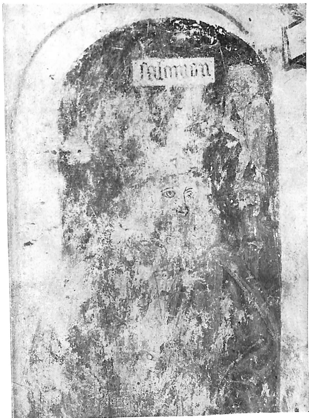
Lám. XII.—Salomón (detalle), en el lado izquierdo del lucillo de la Inmaculada de Peñafiel. Museo Arqueológico de Valladolid.