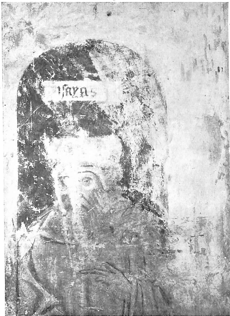
Lám. XIII.—Isaías (detalle), en el lucillo de la Inmaculada de Peñafiel. Museo Arqueológico de Valladolid.