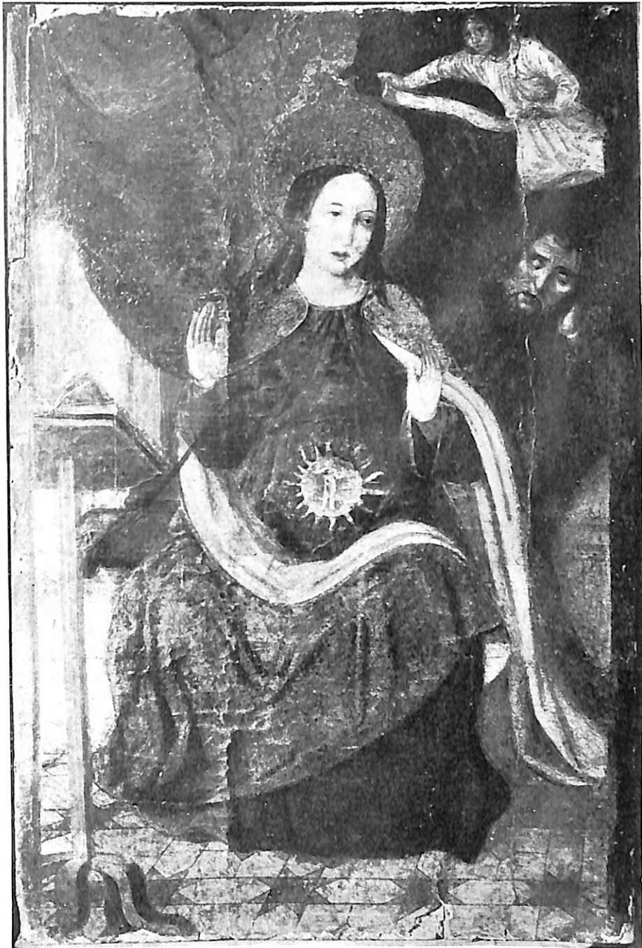
Lám. IV.—¿Rodrigo de Osona? Nuestra Señora de la O.