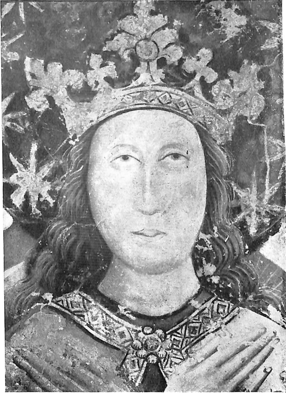
Lám. II.—La Inmaculada de Peñafiel. Museo Arqueológico de Valladolid (detalle).