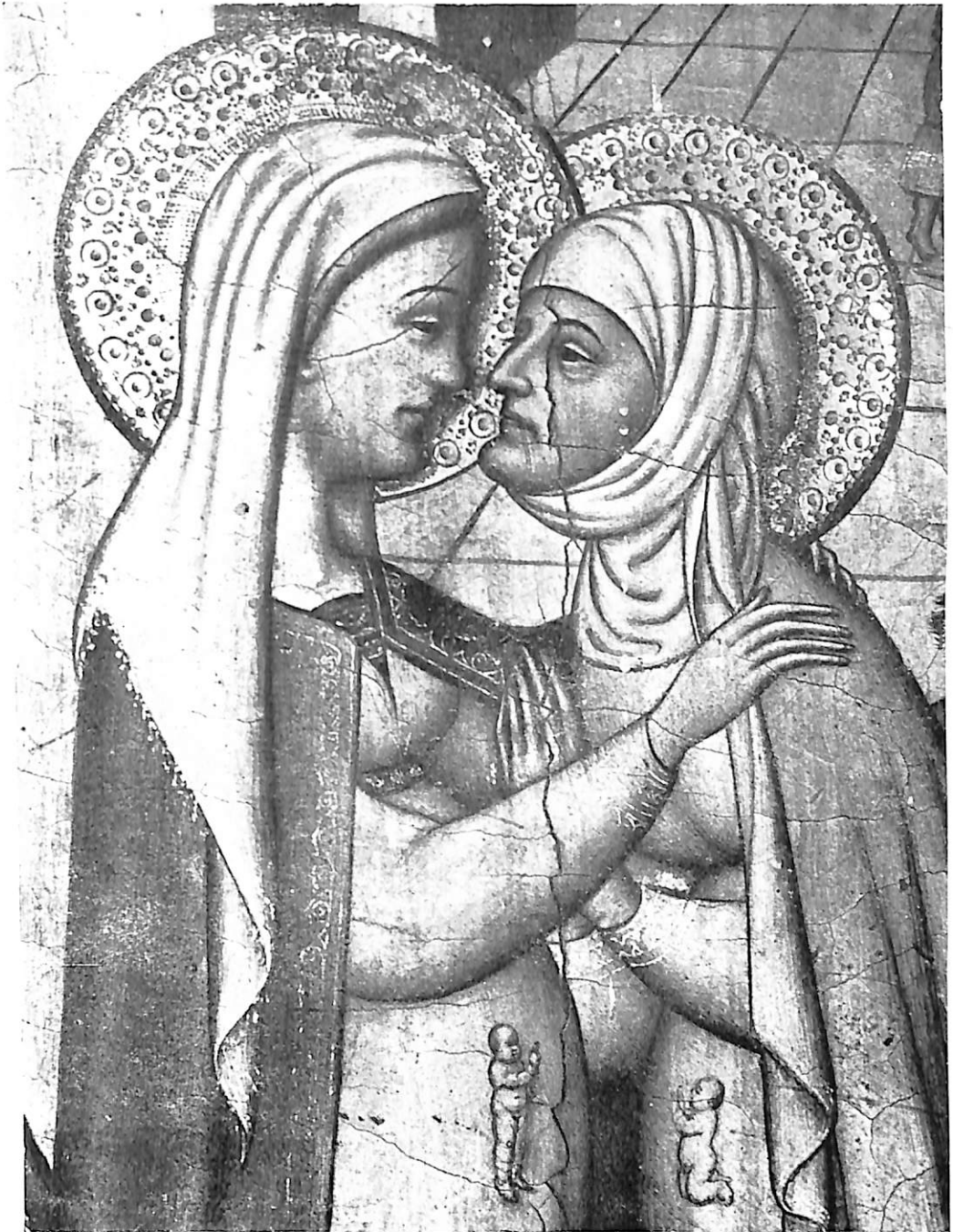
Lám. VI.—Nicolás Florentino. La Visitación. Retablo de la Catedral Vieja de Salamanca. Detalle. (Fot. Archivo Mas).