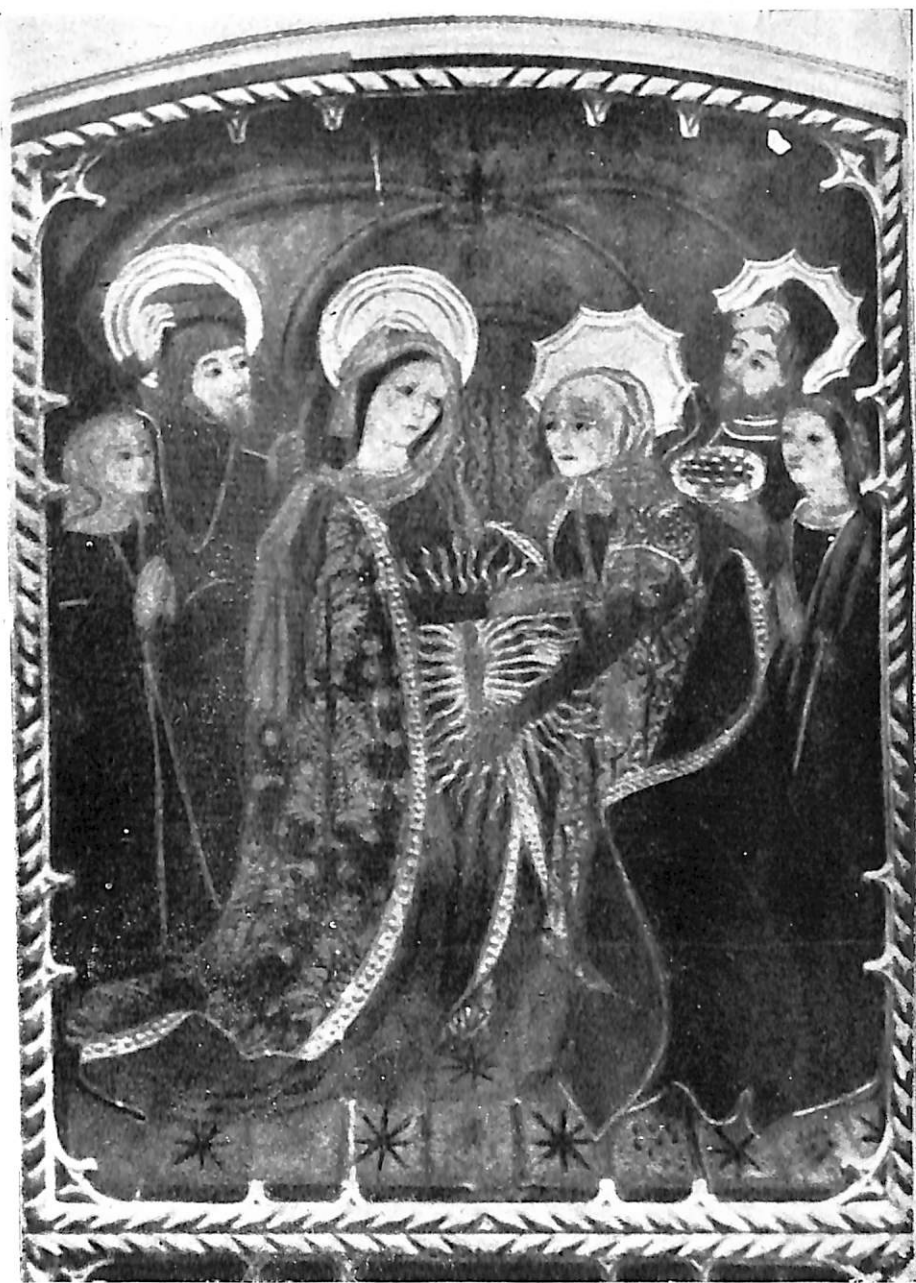
Lám. V.—Escuela Aragonesa. La Visitación. Detalle del retablo conservado en la Hispanic Society of America. (Reproducido de la obra de E. du Gué Drapier, citada en el texto).