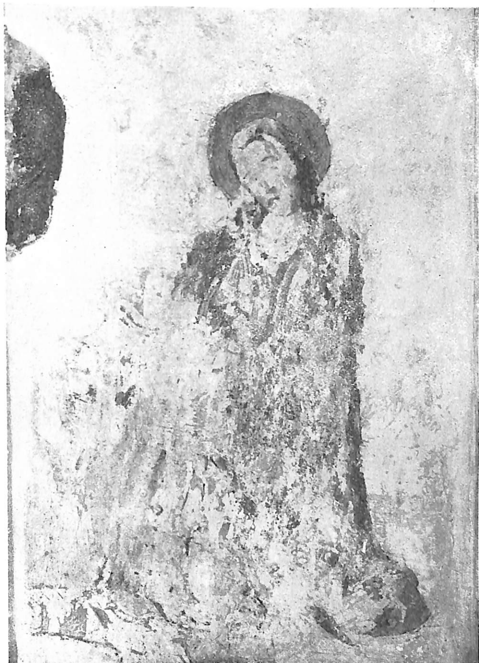
Lám. XI.—Virgen de la Anunciación. Lucillo de la Inmaculada de Peñafiel. Museo Arqueológico de Valladolid.