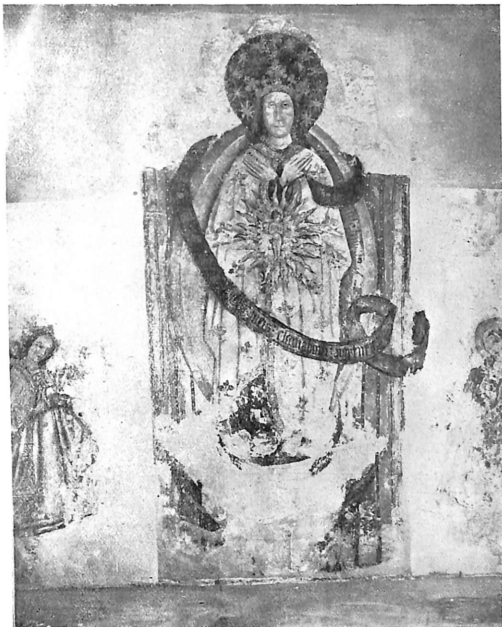
Lám. I.—La Inmaculada. Fresco conservado en el Museo Arqueológico de Valladolid. Procede del Convento de San Pablo de Peñafiel.