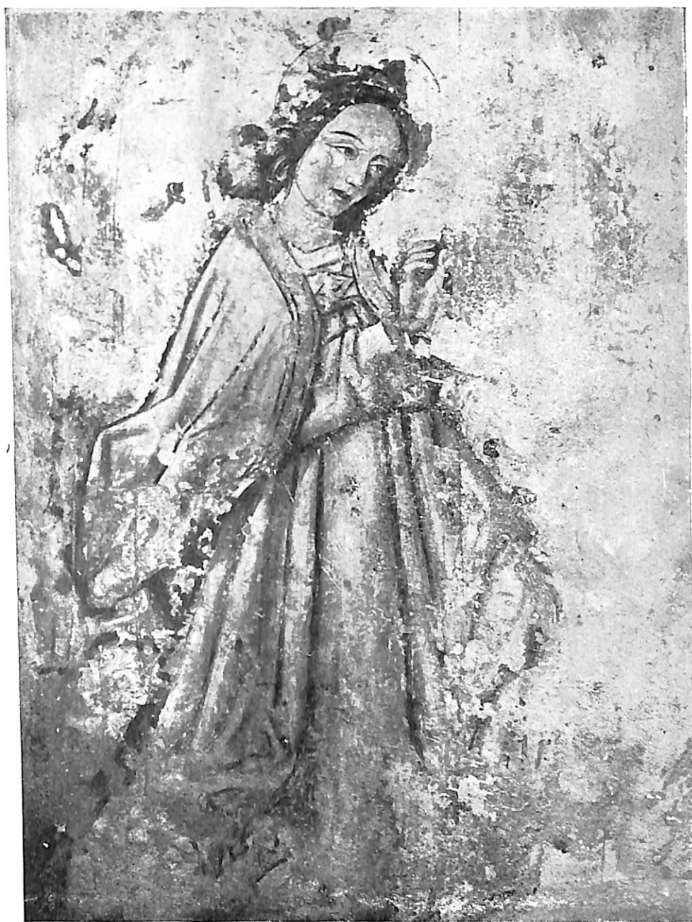
Lám. X.—Angel de la Anunciación. En el lucillo de la Inmaculada de Peñafiel. Museo Arqueológico de Valladolid.