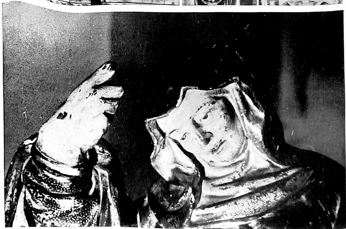
Junquera de Ambía (Orense). Retablo Escuela de Vigny. Iglesia del Carmen (Valladolid). La Virgen, por Juni.