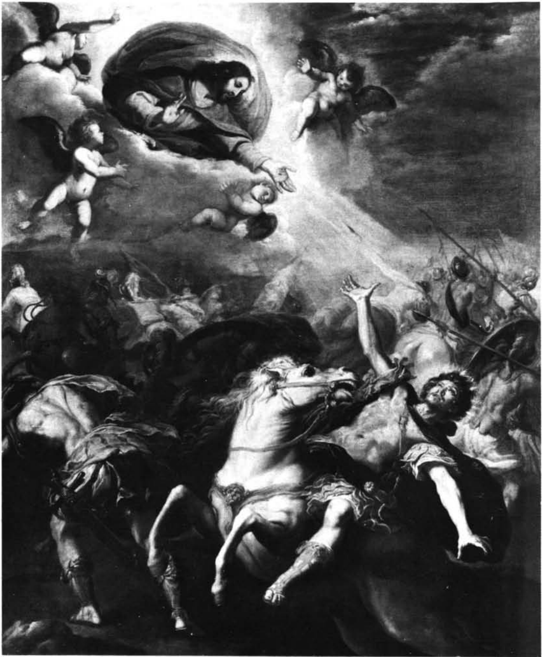
Valencia. Colección particular. Conversión de San Pablo, por Vicente Carducho.