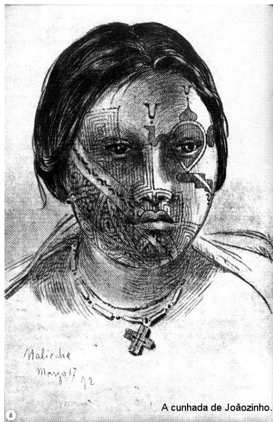
Figura 7 - retirada do livro Tristes Trópicos de Lévi Strauss

Toda a concentração do trabalho foi realizada no queixo e maxilar direito aproximando-se das maçãs do rosto tendo como direção sudeste – norte. Se o rosto for olhado como a diagramação dos pontos cardeais, a disposição do traçado gráfico está na região oeste com uma leve tendência para o lado norte, localizando-se no olho esquerdo e suas adjacências, com mais intensidade. Nota-se claramente a procura de uma situação de equilíbrio. Os símbolos utilizados são os labirínticos (ambos que aqui se apresentam são de origem remotíssimas. O scapula utilizado como ponto de apoio indicando tratar-se de uma mensagem religiosa e o de convergência é um elemento altamente religioso e a convergência para o ponto central está ligado aos ritos de fertilidade), as linhas onduladas (um dos primeiros símbolos utilizados na editoração, juntamente com os outros símbolos aqui representados indica uma ação em andamento, com sentido repetitivo), demarcação