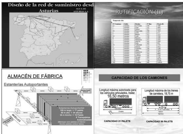
Figura 3. Algunas presentaciones del trabajo 2 realizadas por los alumnos.