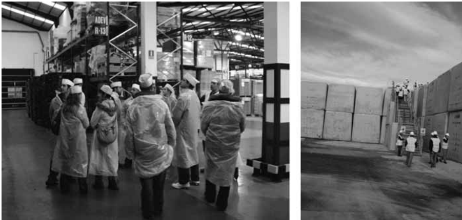
Figura 1. Visitas realizados con los alumnos en enero de 2006.

De modo complementario, las clases prácticas se han visto enriquecidas con la visita a empresas (figura 1) adaptadas a los conocimientos adquiridos en el aula, donde los alumnos pueden observar en un entorno real algunos de los problemas analizados en clase y las dificultades a la hora de buscar sus soluciones.