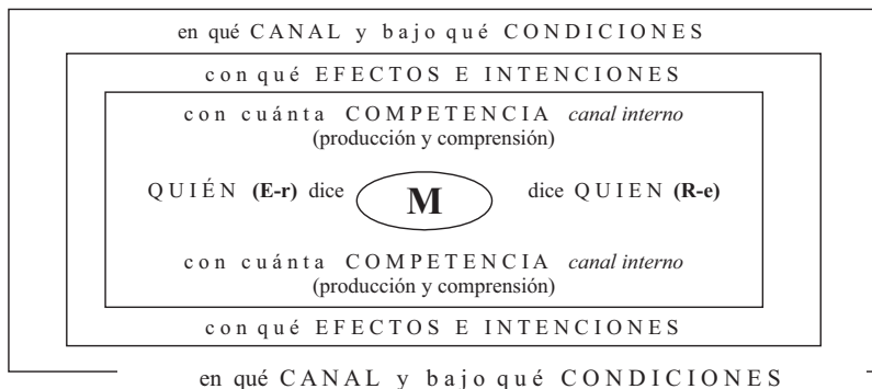
Gráfico 3. Esquema de comunicación (Palencia, I., 2005).

Ahora bien, los roles coprotagónicos del emisor y el receptor, los estímulos y respuestas y los procesos inversamente proporcionales más simultáneos de comprensión y producción se resumen en un esquema como el siguiente, presentado por Palencia (2005) en otras comunicaciones.