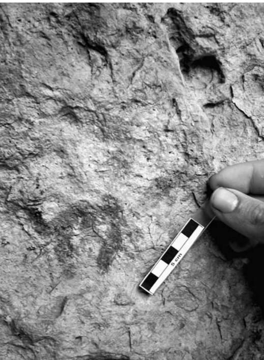
Foto 2. Representació esquemàtica d'un possible zoomorf de l'abric dels Masets III.