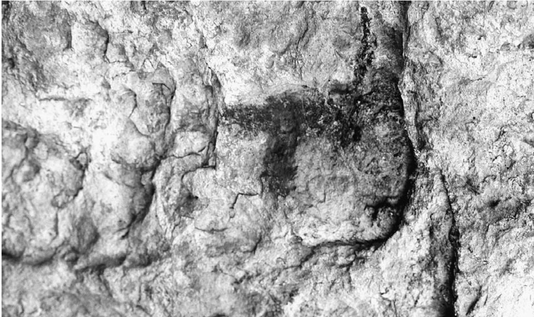
Foto 1. Representacions esquemáticoabstractes de l'abric dels Masets III.

Les pintures es concentren a la paret de l'extrem E, tot i que també s'han pogut percebre algunes restes de pigment al sostre ennegrit de la coveta interior. El grup més nombrós està format per sis representacions esquemáticoabstractes pintades amb tons vermellosos. Es tracta d'un possible ídol antropomorf oculat, un altre en forma de T, un possible zoomorf, una taca o marca no identificada i alguns restes (fotos 1 i 2). El conjunt encaixa amb els tipus descrits pels períodes compresos entre el Neolític i l'edat del bronze.