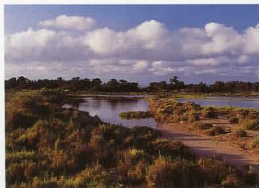
Saladares con vegetación halófila en los márgenes del Estany des Peix.

E l Archipiélago de las Baleares, situado en el Mediterráneo occidental, al Este de la Península Ibérica, está constituido por cuatro islas (Mallorca, Menorca, Ibiza y Formentera) y todo un conjunto de islotes (Cabrera, Dragonera, Conejera, Tagomago, etc. ). Los griegos diferenciaron el archipiélago en dos grupos de ínsulas: por un lado, las islas Pitiusas (Ibiza y Formentera), llamadas así por la abundancia de pinos en las mismas y, por otro, las Gimnesias (Mallorca y Menorca), debido a que sus habitantes iban desnudos.