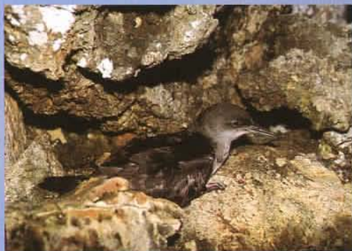
Ejemplar adulto de Pardela Balear o "Viroto" ( Puffinus mauretanicus ), endemismo de las islas Baleares.

P ero, sin lugar a dudas, la importancia de estos humedales radica en su función como área de descanso para las aves migratorias. Las características de estas lagunas, con aguas hipersalinas, orillas limosas y zonas inundables según las fluctuaciones de las mareas, hacen que en tales lugares se asienten, en sus pasos migratorios, aves como el Flamenco Común ( Phoenicopterus ruber ), propia de zonas de salinas, y ocupando las orillas se encuentra el grupo de las limícolas, por ejemplo: Andarrios Chico ( Actitis hypoleucos ), Correlimos Menudo ( Calidris minuta ), Correlimos Zarapitín ( Calidris ferruginea ) y Archibebe Claro ( Tringa nebularia ). Dentro de este mismo grupo existen unas cuantas especies que nidifican en los márgenes de estas lagunas: la Cigüeñuela Común