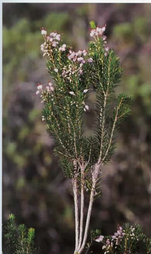
Ejemplar de brezo ( Erica multiflora ) en plena floración.

Los valores naturales que alberga y su buen estado de conservación, hacen de Formentera uno de los mejores y más maravillosos enclaves de las Baleares. A esto hay que sumarle el hecho de que, a pesar de su pequeño tamaño, se encuentren representados un gran número de ecosistemas, lo que convierte a Formentera en un claro ejemplo de isla mediterránea. ●