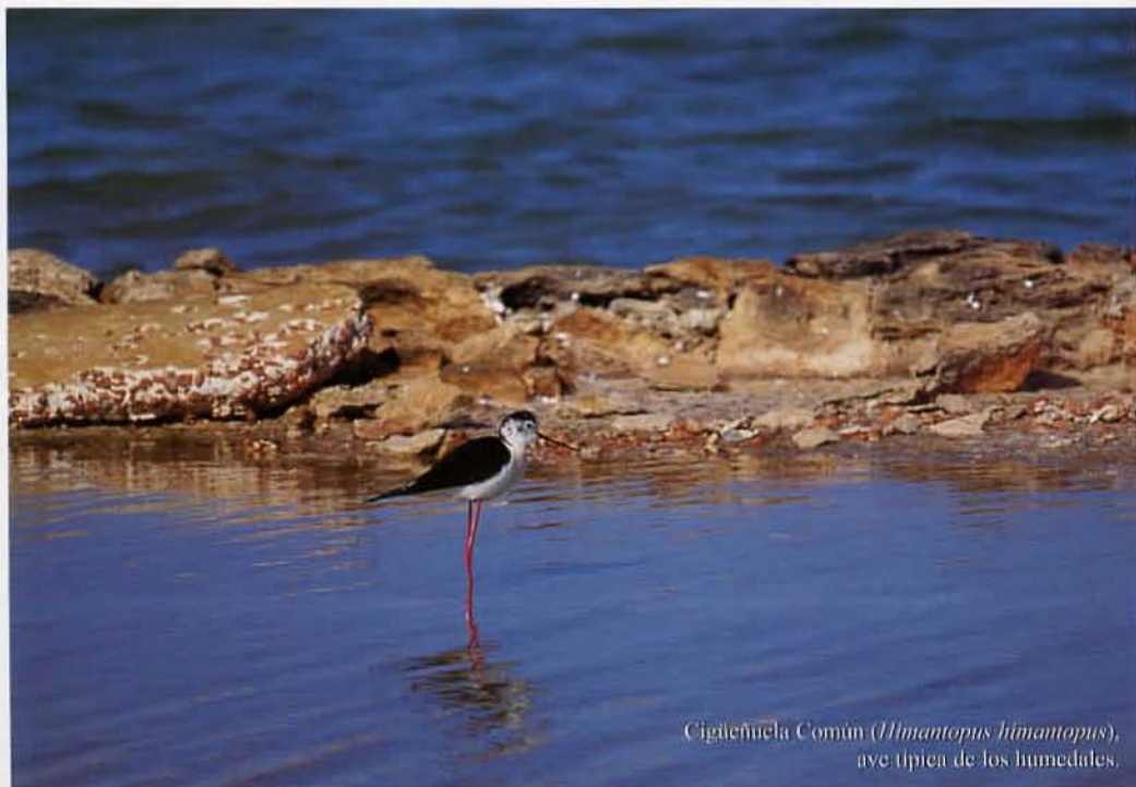
Cigüeñuela Común ( Himantopus himantopus ), ave típica de los humedales.

sabina ( Juniperus phoenicea ssp. turbinata ), muy abundante en Pitiusas, mientras que en el resto de Baleares es una especie escasa, donde forma auténticos bosquetes junto con el lentisco ( Pistacia lentiscus ) y ocasionalmente con Cistus clusii . Estos parajes albergan diversos taxones endémicos, como Senecio leucanthemifolius y Chaenorhinum formenterae . La sabina, además de formar pequeñas masas boscosas en el sustrato arenoso, está presente dentro de un hábitat más propio de la especie: los sabinares. Estos ecosistemas los podemos encontrar a lo largo de toda la isla, predominando básicamente en los suelos pedregosos más antiguos; caracterizan las zonas altas de los acantilados, como es el caso del Cap de Berbería. Acompañando a la sabina, encontramos el romero ( Rosmarinus officinalis ), el tomillo ( Thymbra capitata ) y Cneorum tricoccon , planta esta última representante de la familia Cneoraceae , compuesta únicamente por tres especies, una de las