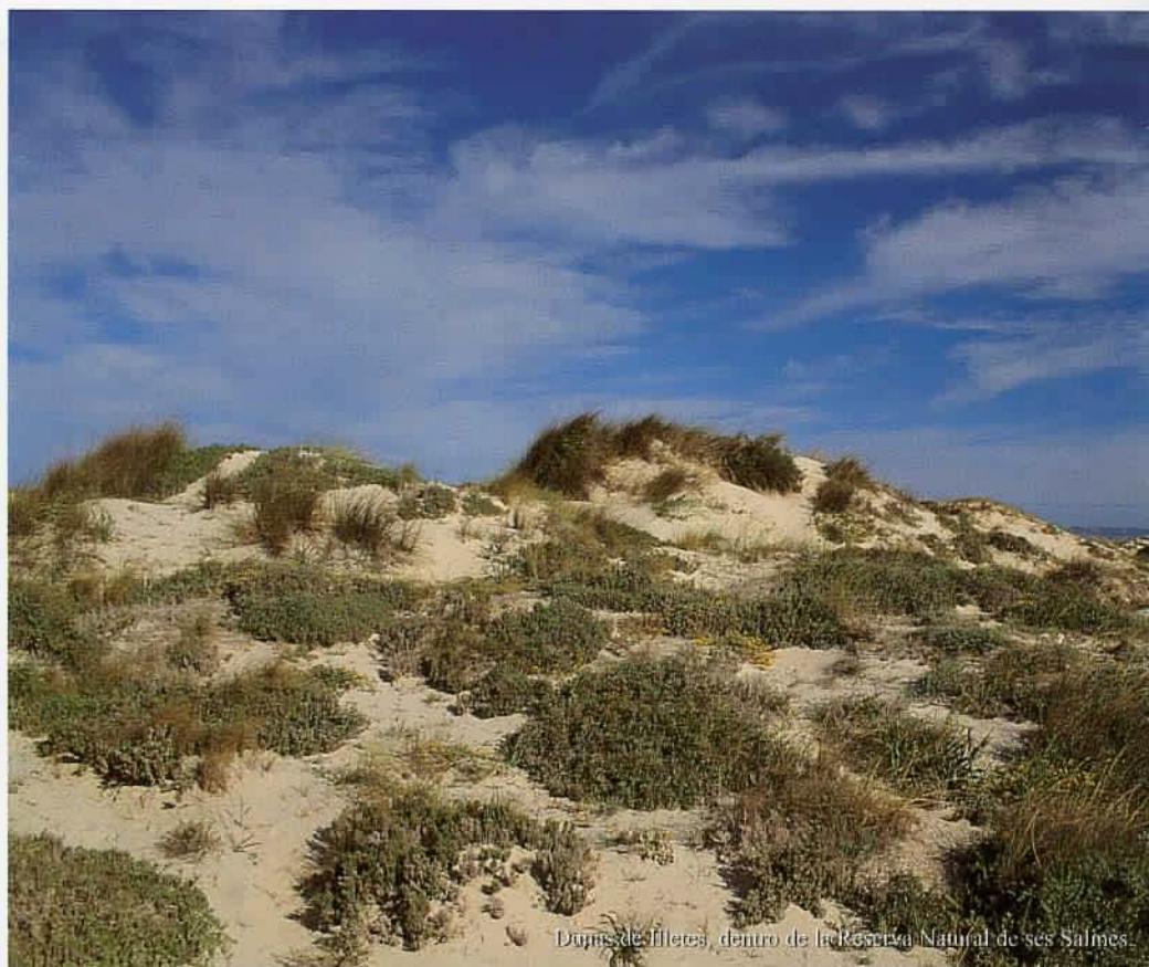
Dunas de Illetes, dentro de la Reserva Natural de las Salinas.

( Himantopus himantopus ), el Chorlitejo chico ( Charadrius dubius ) y el Chorlitejo Patinegro ( Charadrius alexandrinus ). Este último no está relegado a estos saladares, también nidifica en diversos puntos del litoral. Volviendo a las especies de paso que podemos encontrar en esta zona, citemos al grupo de las Ardeidas, representadas en este caso por la Garceta Común ( Egretta garzetta ), la Garza Real ( Ardea cinerea ) y, de forma algo más excepcional, la Garza Imperial ( Ardea purpurea ). En el Estany Pudent se da la mayor concentración de toda Europa del Zampullín Cuellinegro ( Podiceps nigricollis ); el número de ejemplares es muy fluctuante a lo largo de todo el año, alcanzando el máximo durante los meses estiva-