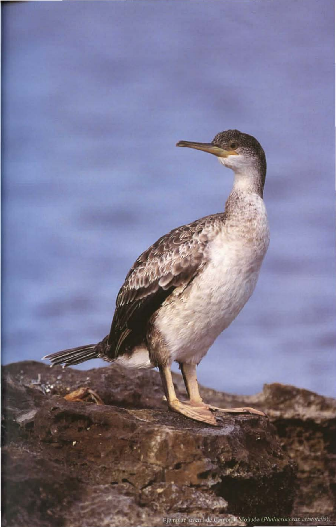
Ejemplar Juvenil de Comorán Moñudo ( Phalacrocorax aristotelis ).