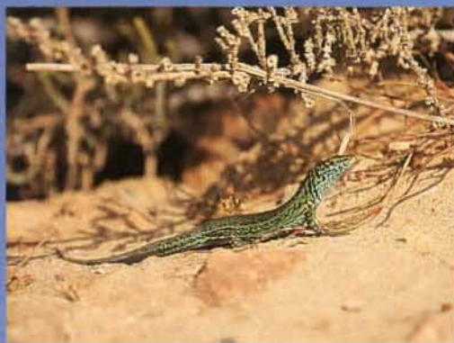
Macho de Lagartija de Formentera ( Podarcis pityusensis formenterae ), endemismo insular

cuales — Neochamaelea pulverulenta — se encuentra en las islas Canarias. En este tipo de ecosistema pueden hallarse diferentes especies orníticas nidificantes, entre las que cabe destacar a la Curruca Sarda ( Sylvia sarda balearica ), propia del Mediterráneo, y el Alcaudón Común ( Lanius senator ). Por último, cabe mencionar a la Lagartija de Pitiusas ( Podarcis pityusensis formenterae ), presente en todos los ecosistemas de la isla, que ha sufrido asombrosas variaciones morfológicas entre las distintas poblaciones insulares, dando lugar a un conjunto de razas geográficas.