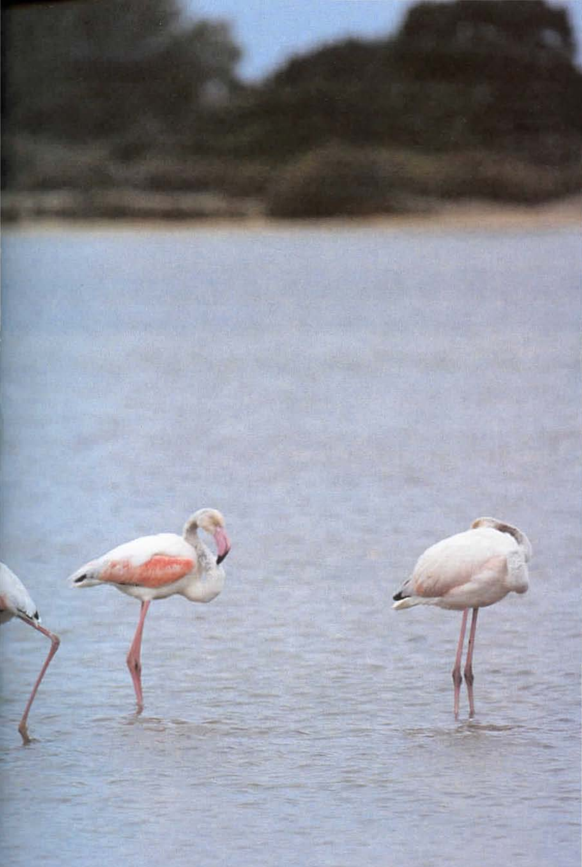
Flamencos Comunes ( Phoenicopterus ruber roseus ) en las orillas del Estany Pudent.