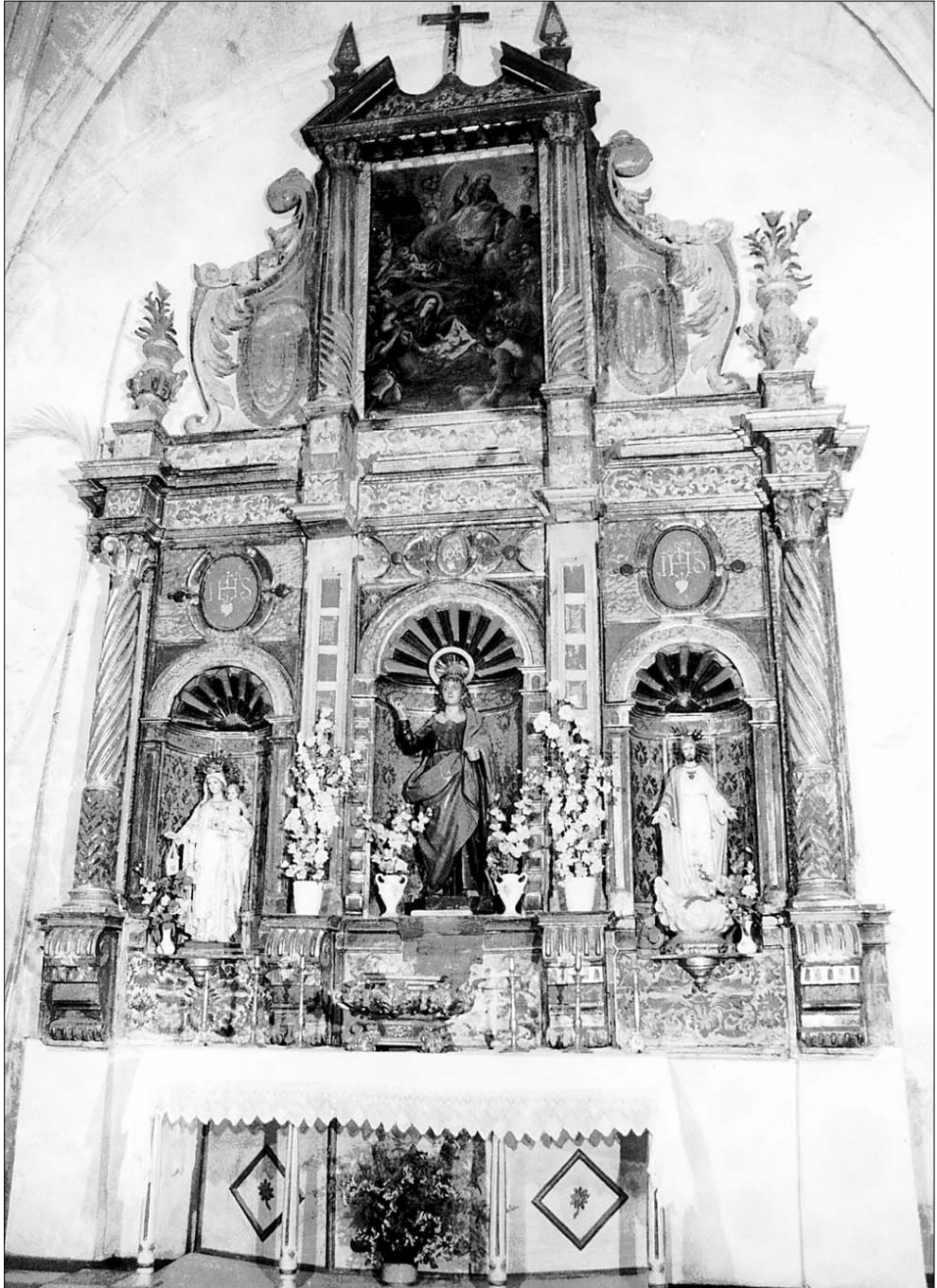
Figura 5. Retablo de la Capilla de San Juan de Letrán de la Iglesia de la Concepción de Caravaca.