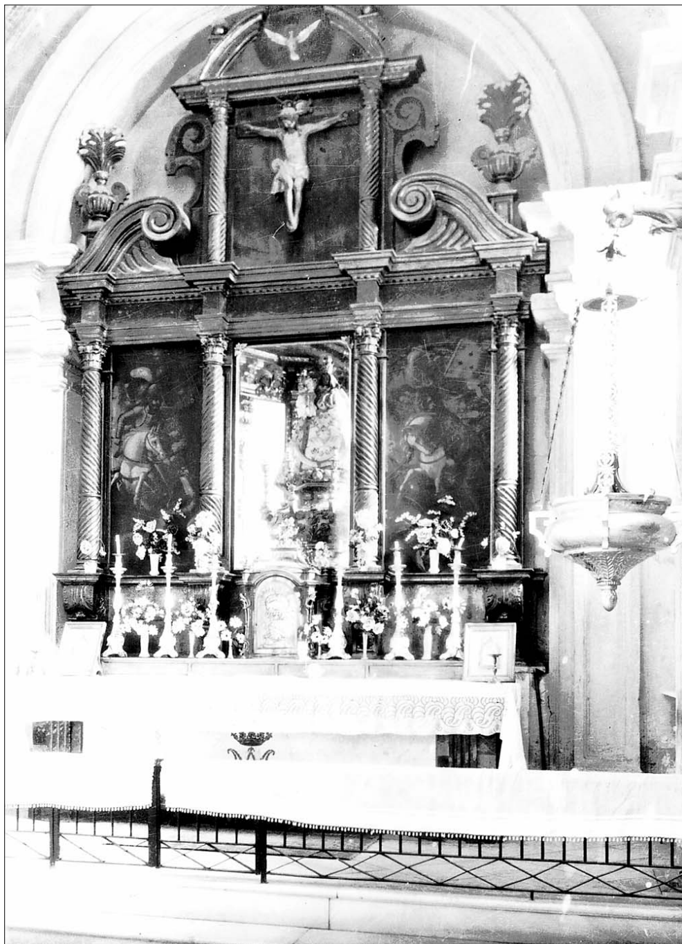
Figura 4. Retablo de la Capilla del Alcázar de la Colegial de Lorca (antes de 1936).