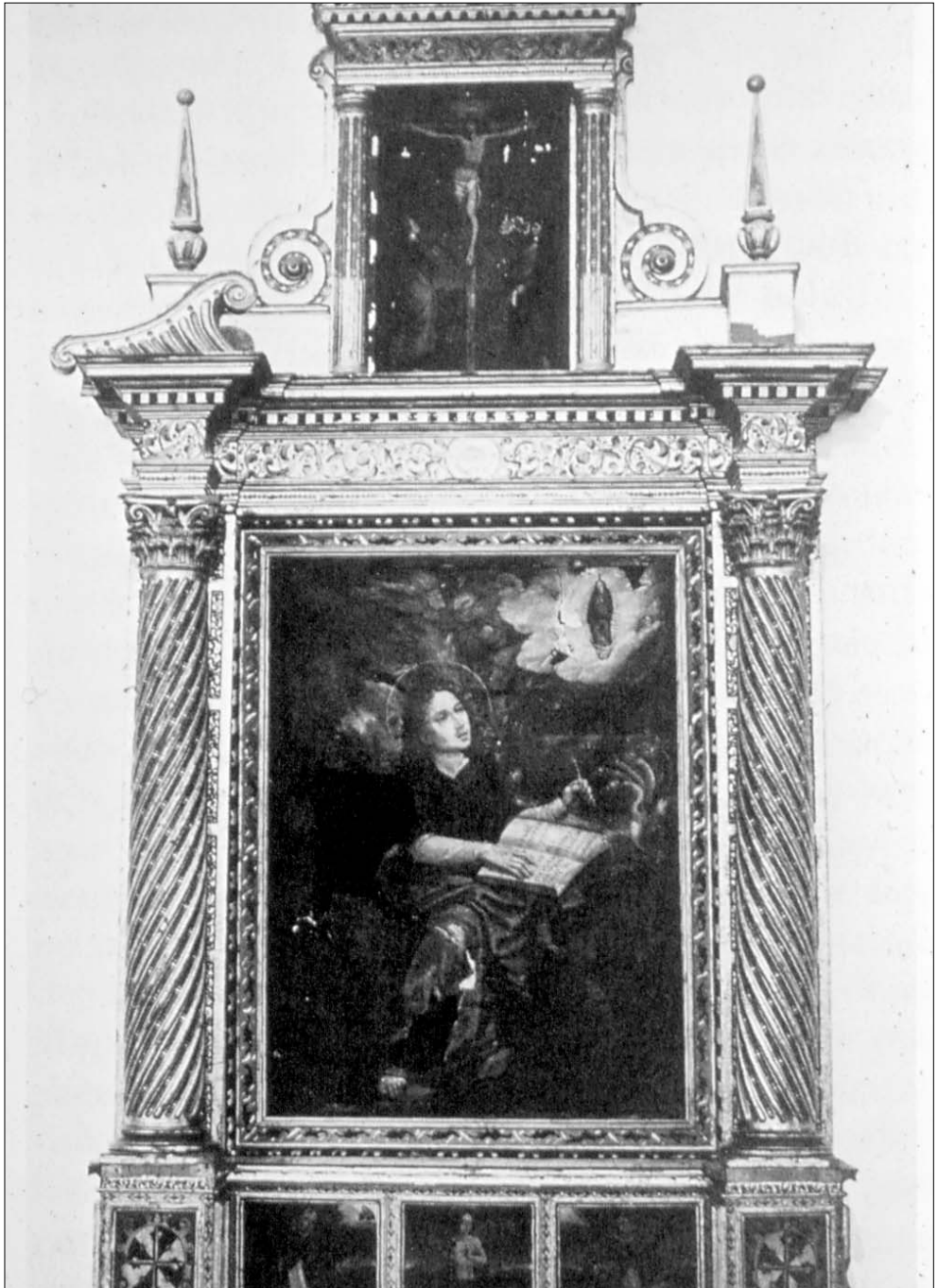
Figura 3. Iglesia de Santa Ana de Murcia. Retablo de San Juan Evangelista.