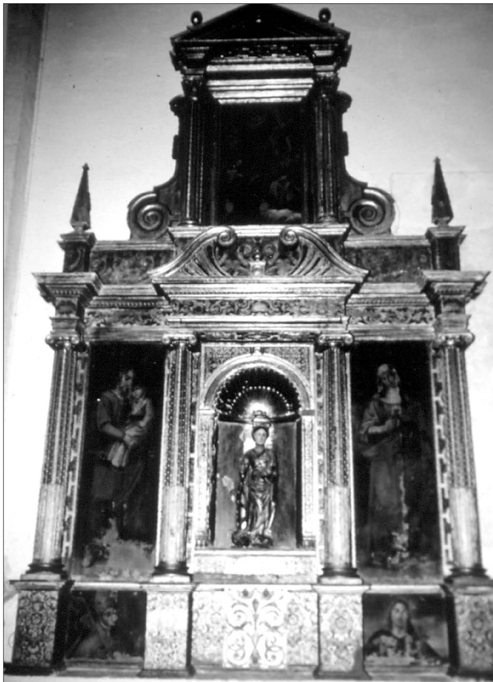
Figura 2. Iglesia Parroquial de Yeste (Albacete). Retablo.