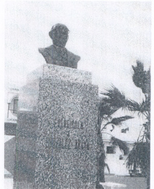
Busto a González Anaya erigido en Fuengirola (Málaga)

Rebelión (1905) La sangre de Abel (1915)