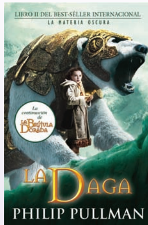
La daga (1998)