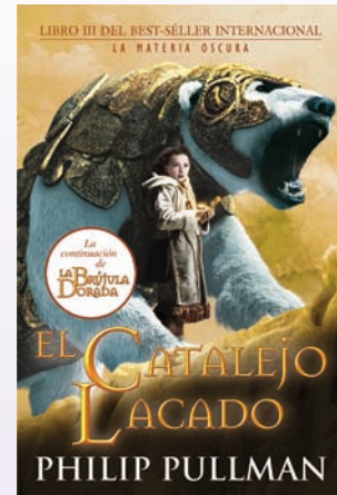
El catalejo lacado (2001)