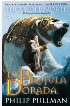
Luces del norte (1997)

Trátase de tres libros escritos por Philip Pullman, un prolífico autor, que acadou o seu maior recoñecemento con esta publicación. Os títulos da triloxía son: