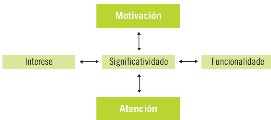
Gráfico 1. Características interrelacionadas das aprendizaxes

outros, 1999; Rogers e outros, 1996; Russel, 1999).