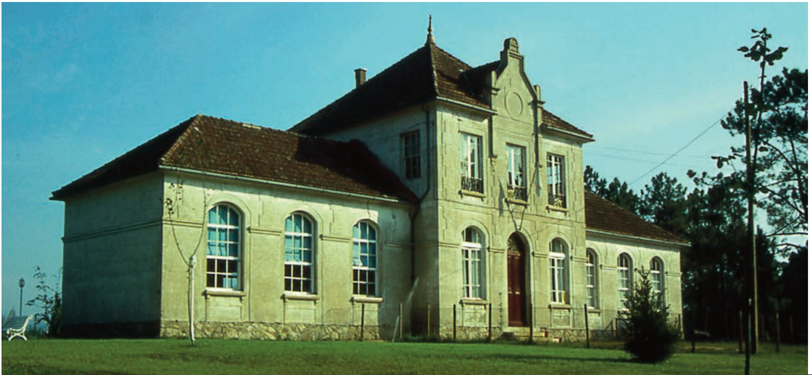
Tomiño, Pontevedra. Escolas Aurora del Porvenir, sostidas dende Brasil e Arxentina pola sociedade do mesmo nome

E isto ocorría a finais do século XIX no mundo rural e mariñeiro galego, onde se sufría un elevado índice de analfabetismo, unha economía agraria de subsistencia, ausencia de tecido industrial e escasas expectativas de futuro. En fin, ocorría baixo o férreo control dunha minoría privilexiada e excluín-te, que detía o poder dende o despacho municipal, o brasón palaciano ou o púlpito dominical, e que perpetuaba aquí o sistema do Antigo Réxime, cando en Europa maduraba a modernidade nacida da Ilustración.