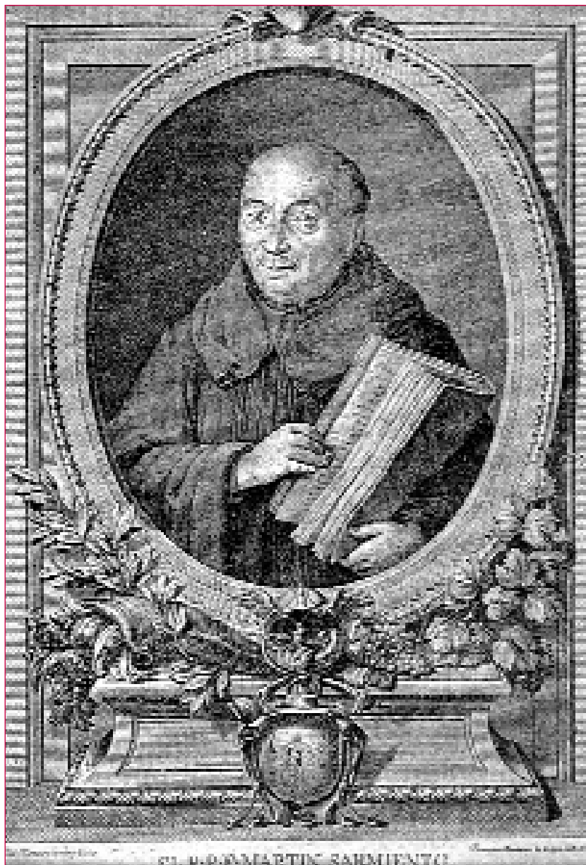
Frei Martín Sarmiento. Gravado de Francisco Muntaner sobre debuxo de José Vicente Cousiño.