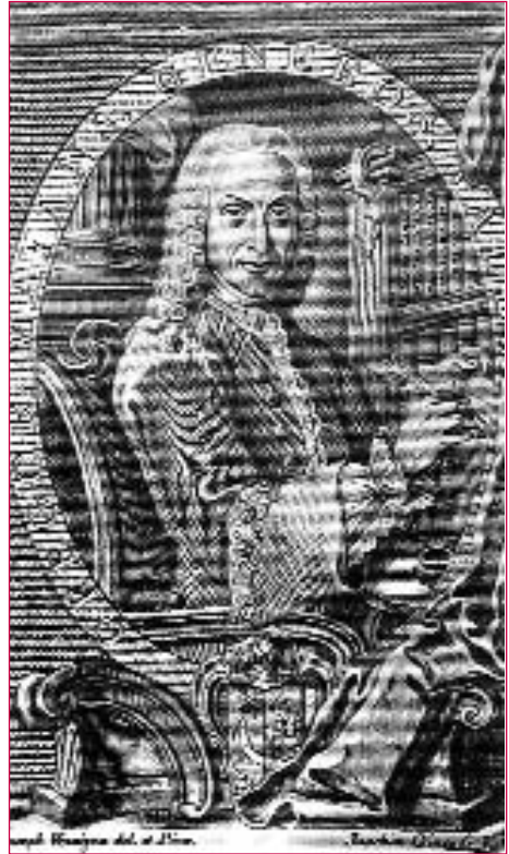
Gregorio Mayans y Siscar. Gravado de Joachim Giner sobre debuxo de Joseph Veragua.

Na España do século XVIII seguramente foi Mayans o primeiro en se referir ós problemas de subsistencia do escritos e en propoñer algunhas solucións 91 . Con todo, o mérito principal correspóndelle a Sarmiento, quen en 1743 lle deu forma a un proxecto cultural denominado Reflexiones literarias para una Biblioteca Real y para otras bibliotecas públicas, hechas [...] en el mes de diciembre del año 1743 92 . En efecto, o proxecto cultural de Mayans, do 1734, titúlase Pensamientos literarios 93 e, aínda que tamén considera —como xa se dixo— os problemas económicos do escritor, non ten a proxección corporativa que si posúe o do beneditino, e isto a pesar de conte-lo xermolo da idea de crear unha “compañía de letras” que si vai desenvolver plenamente o mesmo Sarmiento. Emporiso, convén constatar que as motivacións dun e outro eran, desde logo, ben distintas. No caso do valenciano, buscaba conseguila praza de cronista de Indias; no do galego, propoñer un proxecto cultural institucional que lles dese cabida a numerosos intelectuais, pois nel haberían de estar presentes tódalas ciencias.