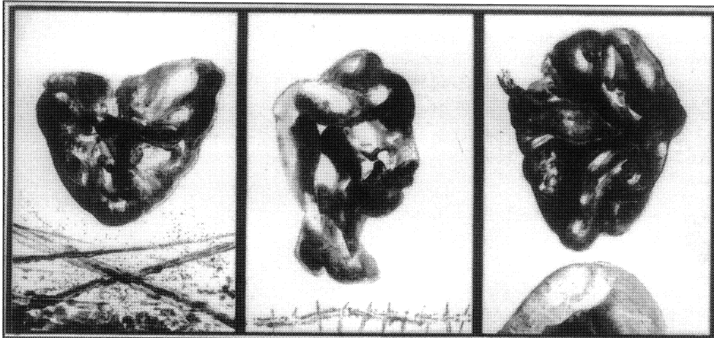
Memorias da guerra, 1999.

— ¿Que funcións cre que pode cumprir a arte, concretamente a pintura, no proceso educativo?