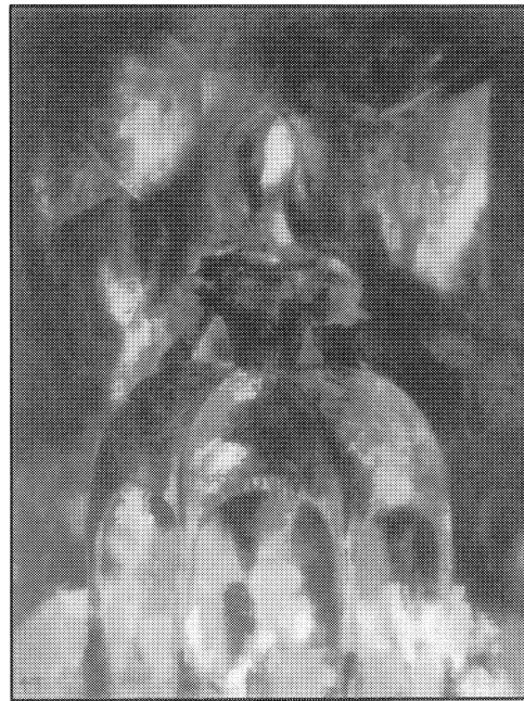
Rapaza de costas ós espellos do pasado, 2001.

—Racionalizar as nosas vidas é adaptarse a unhas normas de conduta do homo sapiens, pero a imaxinación é primordial para crear. Somos coma as plantas, necesitamos unha poderosa raíz para penetrar na terra e absorber todo o que nos rodea na nosa vida cotiá, pero tamén necesitamos afastarnos deste mundo inzado de tensión e ruídos e voar para viaxar por outras dimensións e entrar no imperio do absurdo, e marabillarnos da nosa imaxe axigantada ou mirarnos no espello dos soños coma un anxo que coas súas ás prateadas abarca o