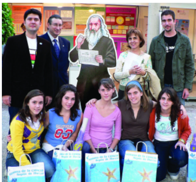
Figura 5. Participantes de la Semana de la Ciencia de Murcia con los autores de este artículo rodeando una imagen en cartón a tamaño real de Mendeléiev.