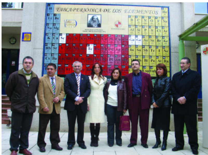
Figura 6. Tabla periódica mural en arcilla roja de grandes dimensiones (3,70 x 2,80 m) ubicada en la fachada principal de la Facultad de Ciencias Experimentales de la Universidad de Jaén.