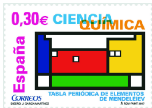
Figura 2. Sello de Correos "Tabla periódica de elementos de Mendeléiev", emitido el 2 de febrero de 2007.

http://www.webelements.com/ para reconocer su espléndida actividad a favor de la difusión de la química. Se revisó el boceto original con el fin de simplificarlo y al final se obtuvo el logotipo definitivo que se muestra en la Figura 1b. Este diseño fue el que se propuso a los responsables de la FNMT-RCM para su incorporación en el sello conmemorativo del primer centenario de la muerte de Mendeléiev, que, a las pocas semanas, fue aceptado por el Servicio español de Correos. En octubre de 2006, los responsables de Correos y de la RSEQ acordaron que el sello dedicado a la Química de la serie Ciencia del año 2007, además de estas dos palabras clave llevaría el texto "Tabla periódica de elementos de Mendeléiev" junto con "Diseño: J. García Martínez", en reconocimiento al diseñador del logotipo. La impresión se realizaría en offset , en papel autoadhesivo fosforescente, con un formato horizontal y tamaño de 40,9 x 28,8 mm, con un valor postal de 0,30 euros, en pliegos de 20 unidades y con una tirada ilimitada, siendo la tirada inicial de 45.725.000 sellos, [3] que se han distribuido de la forma siguiente: Oficinas de Correos, 41.200.000; Oficinas de Logista (estancos), 4.000.000; y Servicio Filatélico de Correos, 525.000 unidades (Figura 2).